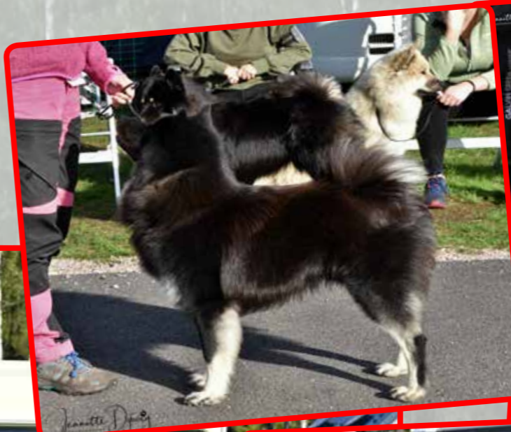
BIR Valp Lupus Ferratus Bingo