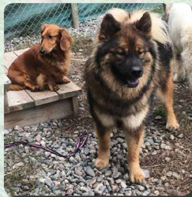
Ludde och Tofflan

Ludde verkar älska sitt dagis. Han är alltid glad att komma dit. En positiv sak är att han nu är väldigt socialt kompetent med andra hundar. Det är aldrig några problem när vi träffar andra hundar.