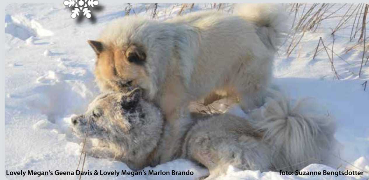
Lovely Megan's Geena Davis & Lovely Megan's Marlon Brando