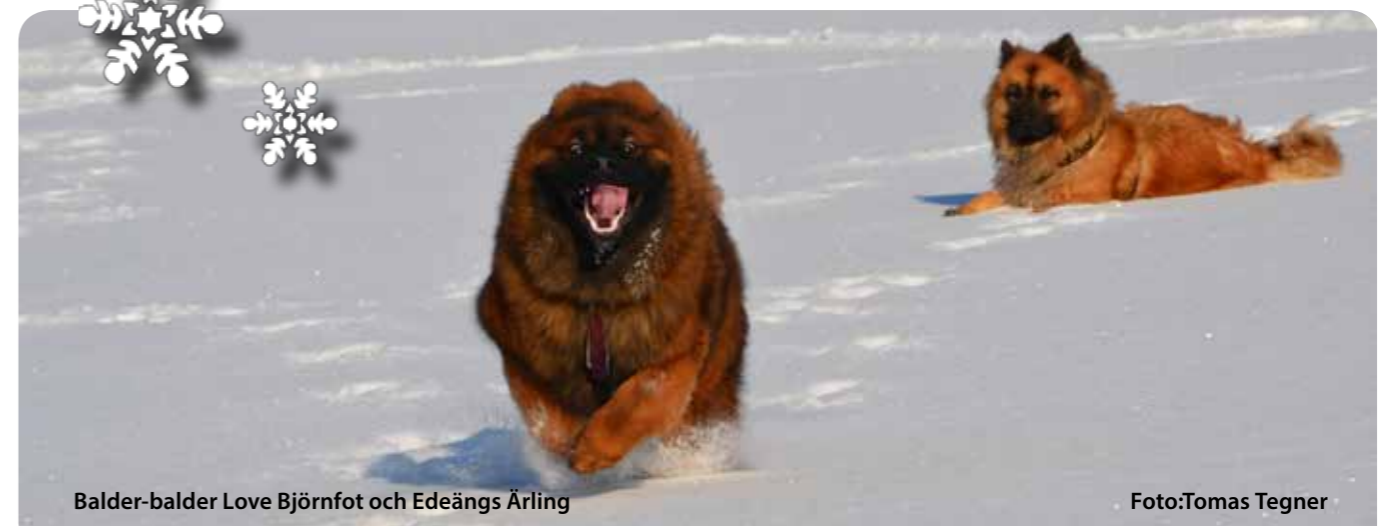
Balder-balder Love Björnfot och Edeängs Ärling