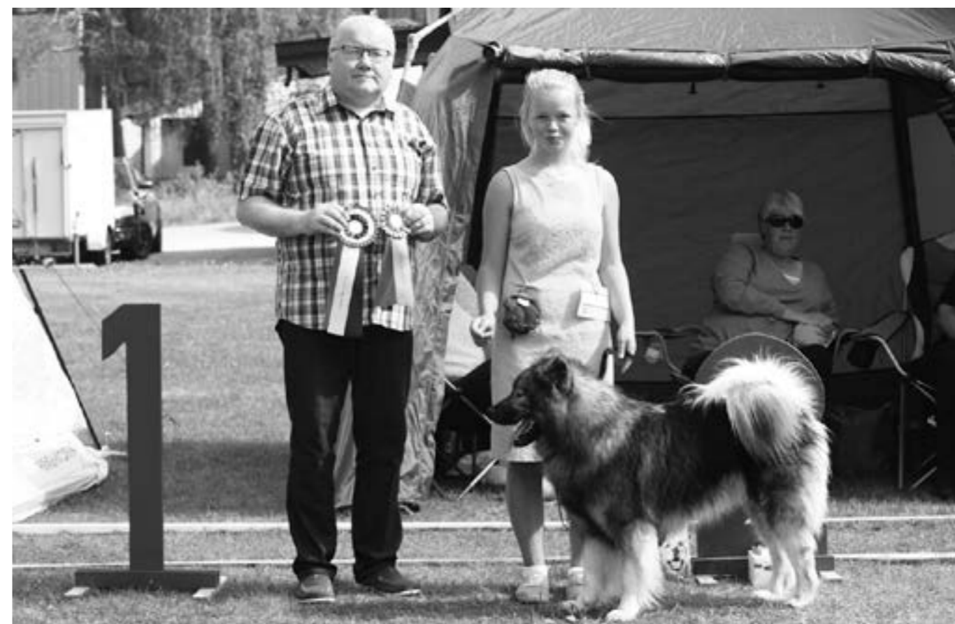
Leiiionspitz Lovely Leon

Det var kun en tisper på meldt i veteran-klassen, Bergliot av Geehrbacch, som også fikk ck.