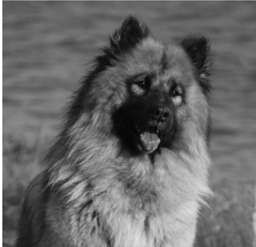
Exempel på en eurasiertik med något maskulina drag Privat foto.

Är det här ett problem inom rasen i Sverige? Finns det då eurasier som premieras och som används i avel trots att de inte har någon tydlig könsprägel? Här handlar det mycket om tycke och smak. Man tenderar nog att acceptera mindre på en hane än på en tik, dvs att man reagerar mindre när