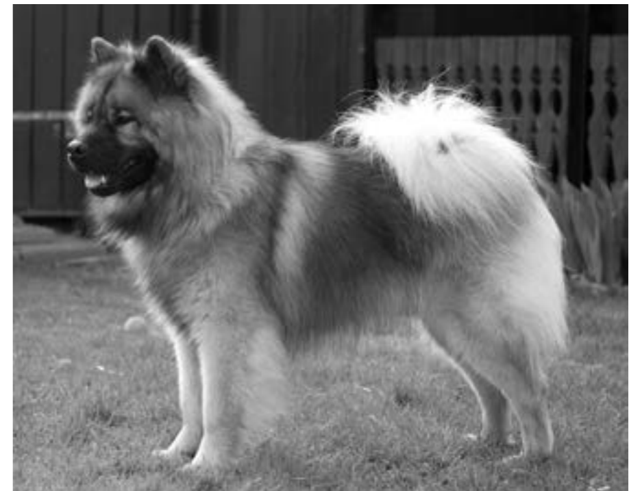
Exempel på en eurasierhane med god könsprägel.