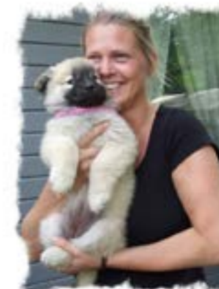
Malin, Knivsta "Sendo"