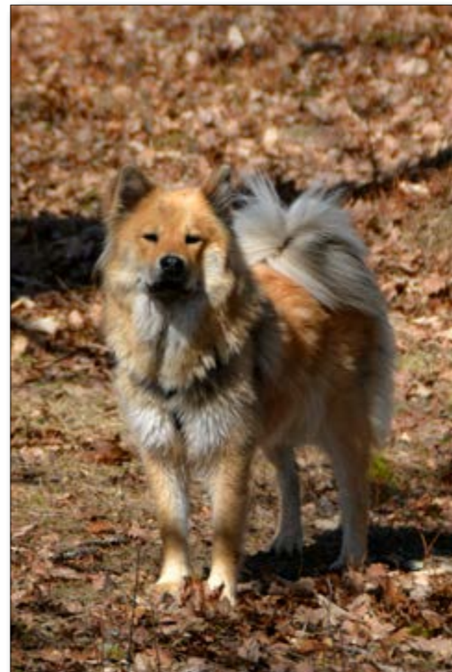
Ex Aminors Angel of Sunshine "Tindra"