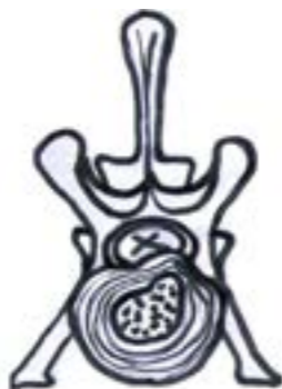
Hansen typ 2 diskbråck

Vid ett diskbråck uppstår ett tryck och en retning på ryggmärgen, nervrötter eller Cauda Equina. Ett diskbråck beror i de allra flesta fall på att disken är degenererad dvs. att diskens uppbyggnad ändrats så att den