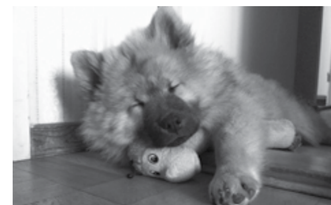
Lovely Megans Izabella Scorupco