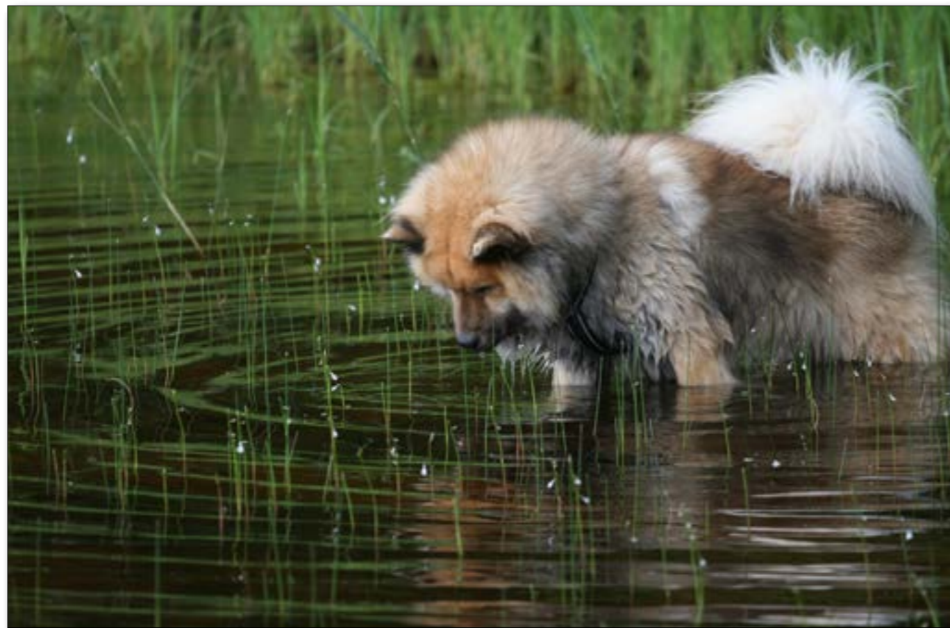
Lovely Megans Frank Oz