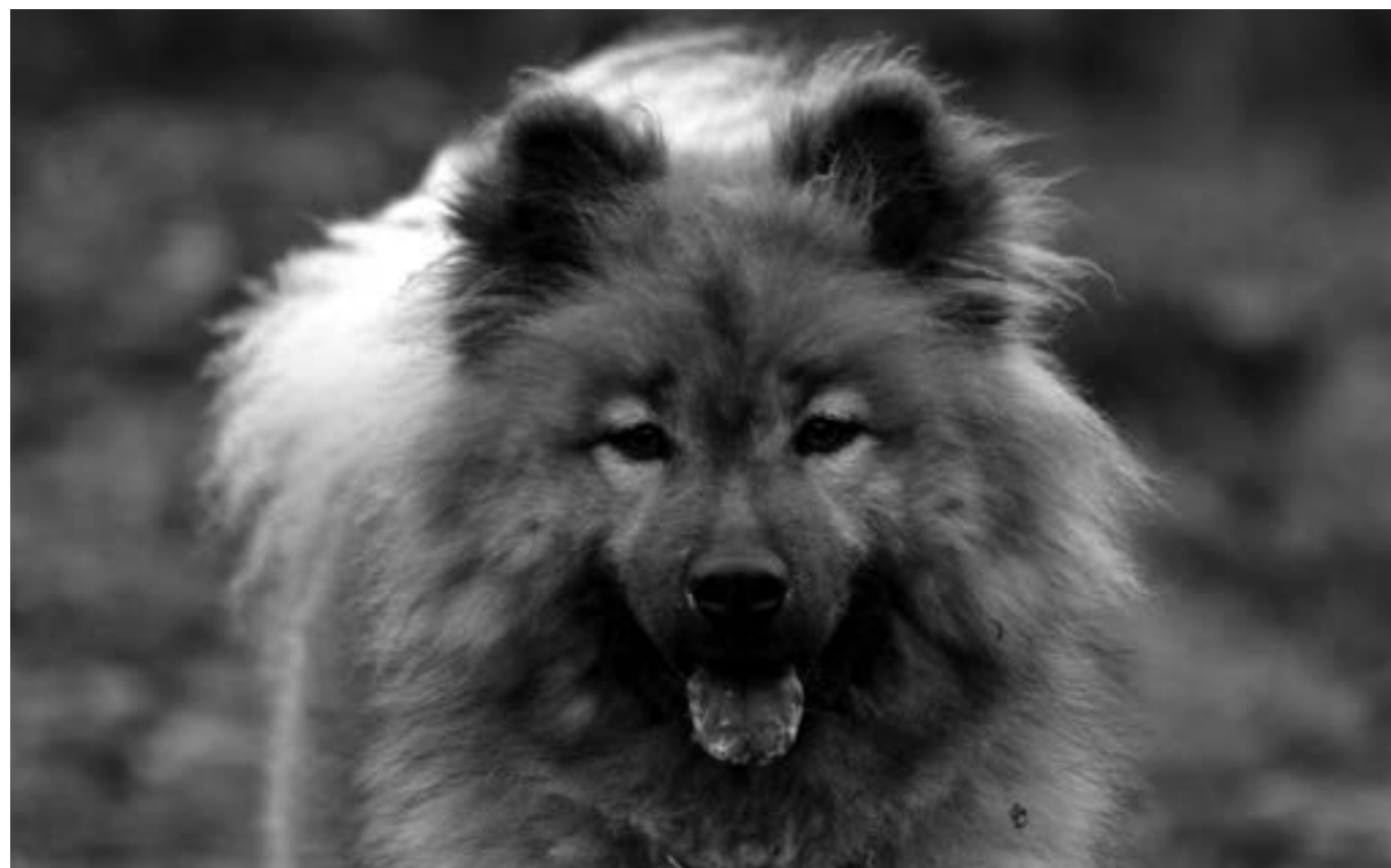
Äta harlortar? Inte skulle väl jag....

Tjuvar. Bland det som står högst i kurs att sno här är mina Foppa-tofflor och då ska det vara de som jag för tillfället använder och inte de som ligger spridda lite här och var i trädgården. Kan reta mig till vansinne att efter en skön stund i solstolen vara utan tofflor IGEN för att därefter barfota försiktigt (man vet ju aldrig vad som döljs) trippa runt i gräset för att leta upp dem igen. Undrar hur många par jag har liggande i trädgården egentligen?