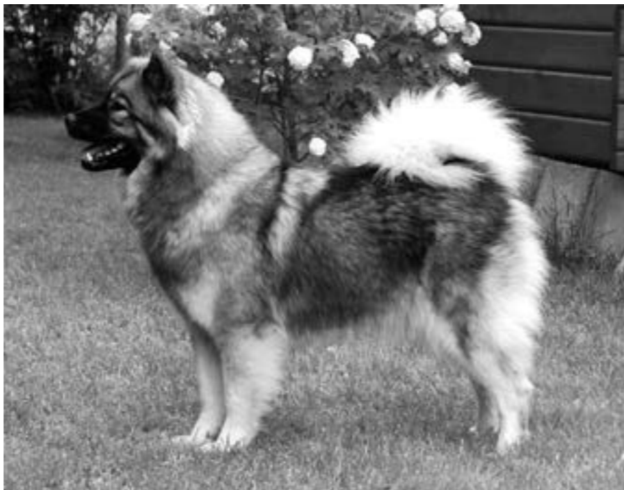
Exempel på en eurasiertik med god könsprägel.

man ser en stor tik, men mera när man ser en liten och spinkig hane.