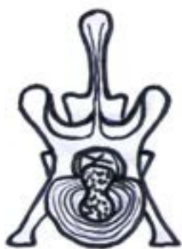
Hansen typ 1 diskbråck.

Hundens rörelseapparat utgörs av skelett, leder, sensor, bindväv, perifera nerver (utanför det centrala nervsystemet) och muskulatur. Hundens ryggkotpelare består av 7 halskotor, 13 bröstkotor, sju ländkotor och 3 korskotor och ett varierande antal svanskotor. För att ryggkotpelaren ska hänga ihop och samtidigt vara rörlig finns det leder mellan kotorna. Lederna hålls samman av ledband och korta muskler. Mellan kotorna ligger diskar med undantag för korskotorna som är sammanväxta.