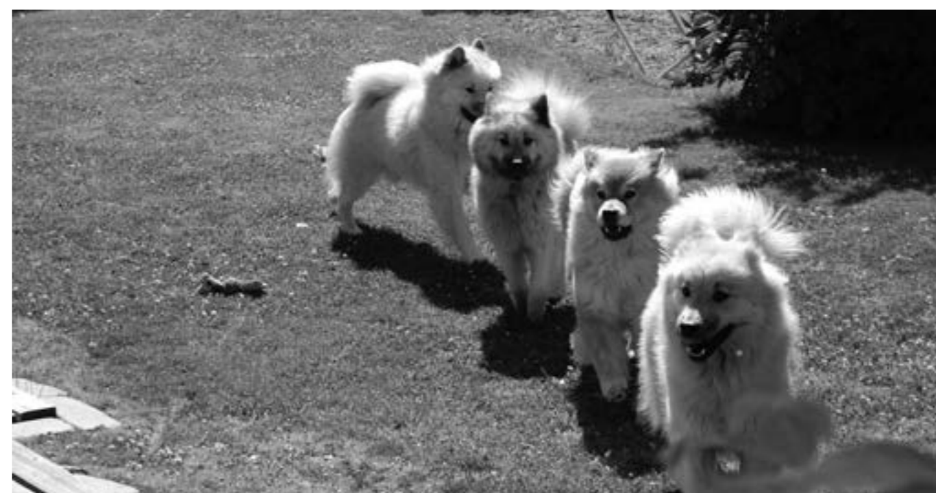
Det är härligt att vara ute i sommarsolen.

Det dröjer drygt 3 år innan förbudet träder i kraft. Svenska Kennelklubben menar att det är viktigt med god framförhållning; förändringen bör vara väl förankrad i organisationen och hundägare väl informerade. Går det för snabbt drabbas hundägare hårt som tagit beslutet om kastration utifrån förutsättningen att deltagande på hundutställning är tillåtet. Kastrerade hundars möjlighet att delta i andra former av tävlingar och prov påverkas inte av beslutet.