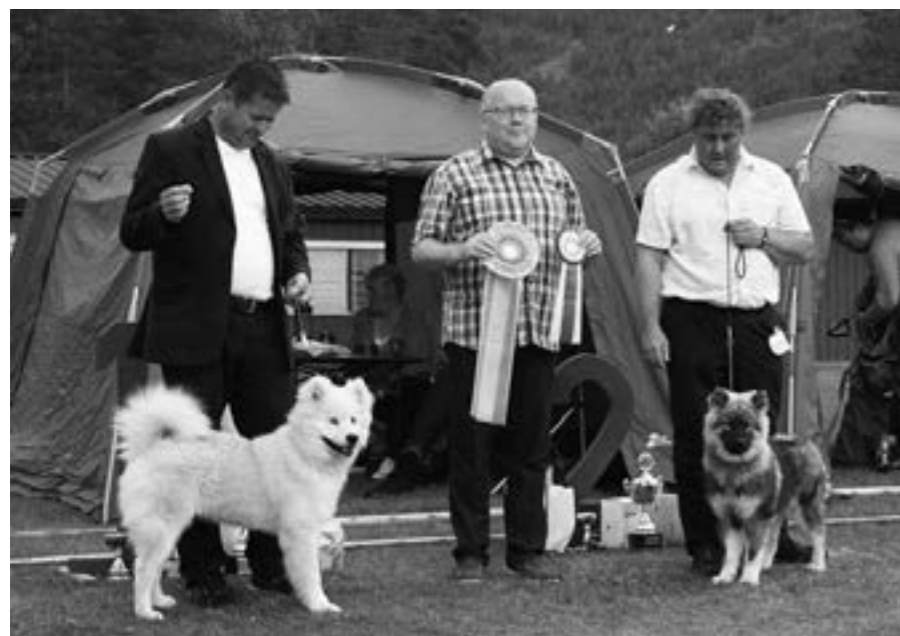
Amentiono's Eico och Paula av Geehrbacch, BIS och BIM valp.

Beste tispesklasse var det ikke uventet Ingeborg av Geehrbacch som tok seieren. Andre plass gikk til Fanakka's Darka. Tredje til Redlance's Kera som fikk certet og vi fikk dagens andre champion!!! Fjerde beste tisper ble Zafira A Princess Named Nemi.