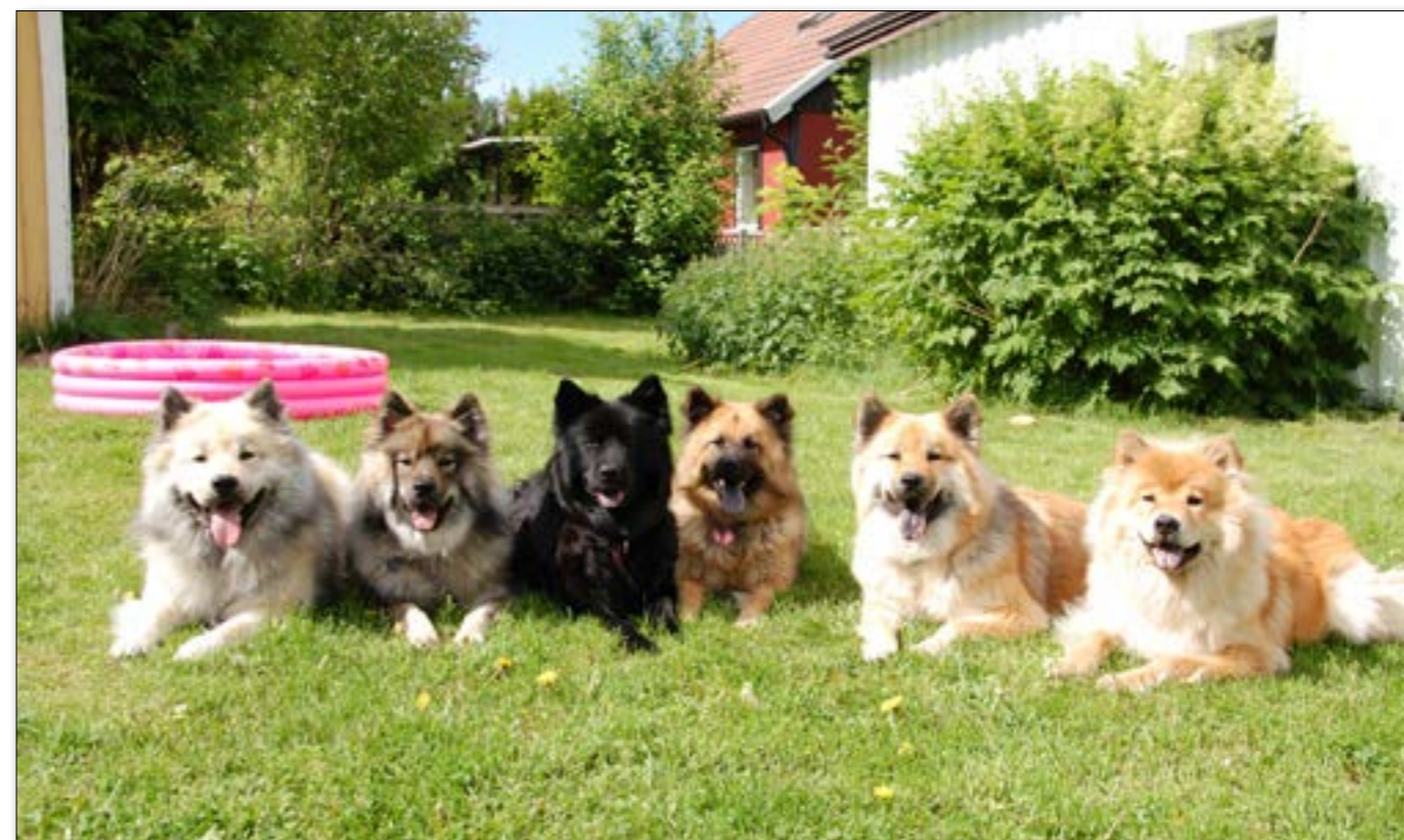
"Rambo", "Nala", "Molly", "Tequila", "Exa" och "Agnes"