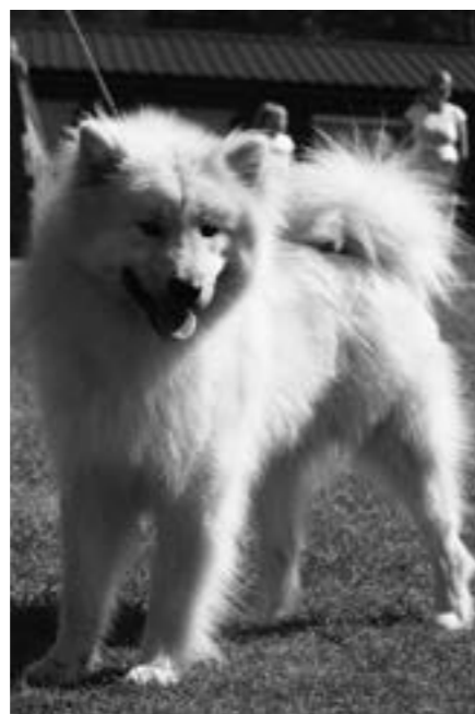
Norbert av Geehrbacch