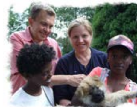
Familjen Roos, Uppsala "Yoshi"