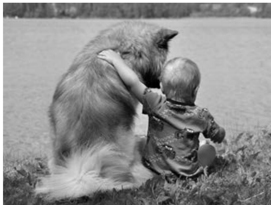
Har du hört att grannens pudel gått och blekt svansen?