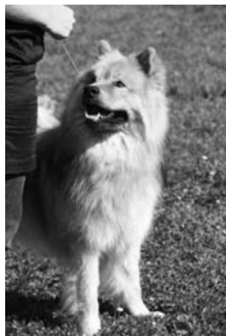
Noah av Geehrbacch