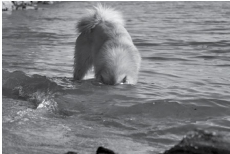
Kanske inte det bästa sättet att släcka törsten på...

Är hunden mer påverkad ska du kontakta veterinär så sätter de in dropp och kanske avslappnande medicin.