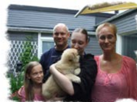
Familjen Thydell, Bålsta "Izzy"