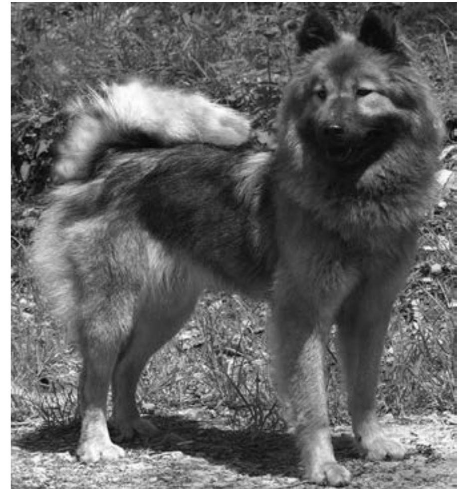
Exempel på en eurasierhane med dålig könsprägel: dåligt utvecklat förbröst, bröstet av otillräckligt djup, och brist på muskelmassa.