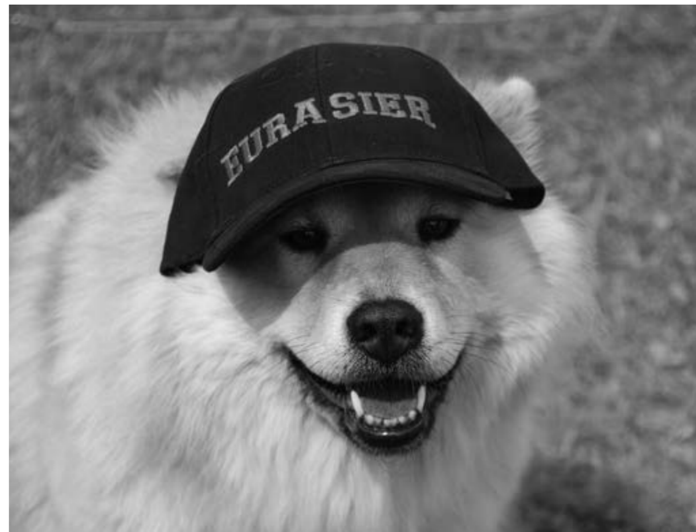
Lejonbols Luna Mons Agnes vet vikten av att hålla huvudet kallt under soliga somrardagar.

Emma Nilsson Älvans väg 5 90750 Umeå Tel: 090-403 12 webmaster@eurasierklubben.se