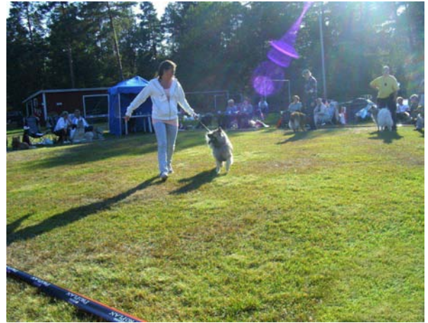
Helkontakt med matte.