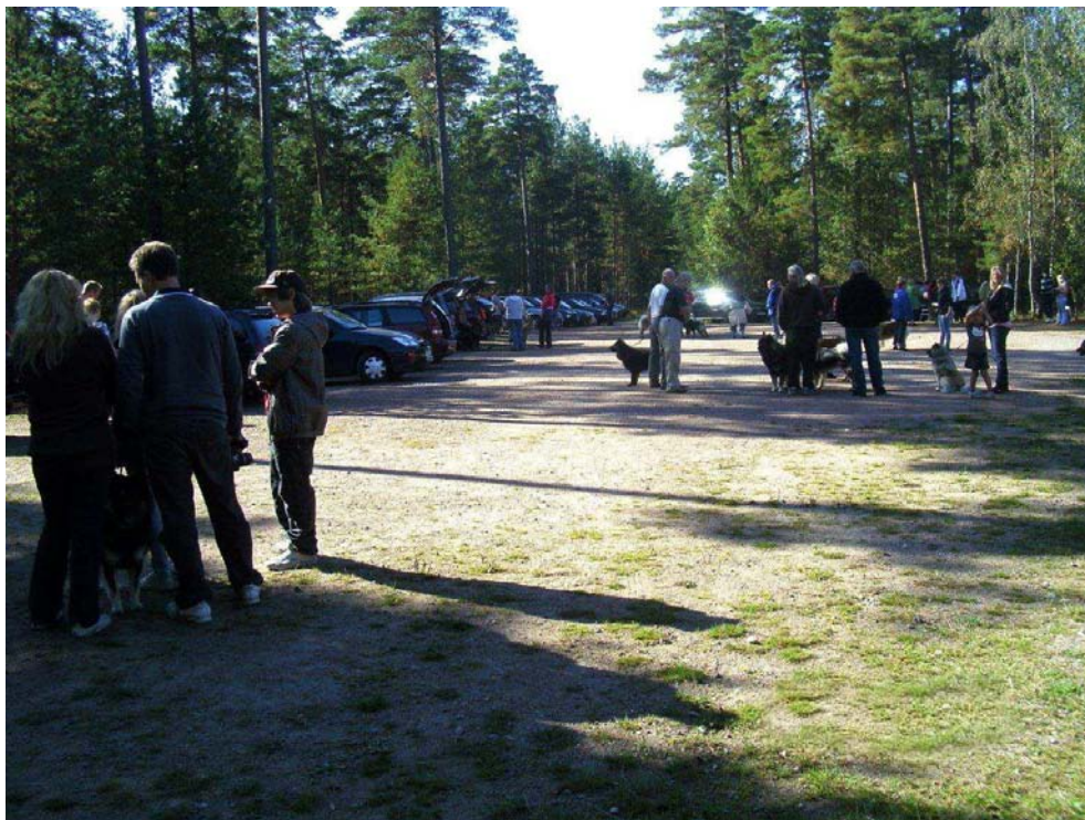
Folk från när och fjärran samlas.

Eftersom det inte blev någon inofficiell utställning i Gränna så var vi ett gäng personer som bestämde oss för att anordna en liten Foxfire-träff i Vimmerby istället. Vi räknade nog med ett 20-tal personer men det blev runt 60 st. Snacka om en kanonuppslutning. De mest långväga familjerna kom från Norge, Stockholm, Sala och Göteborg.