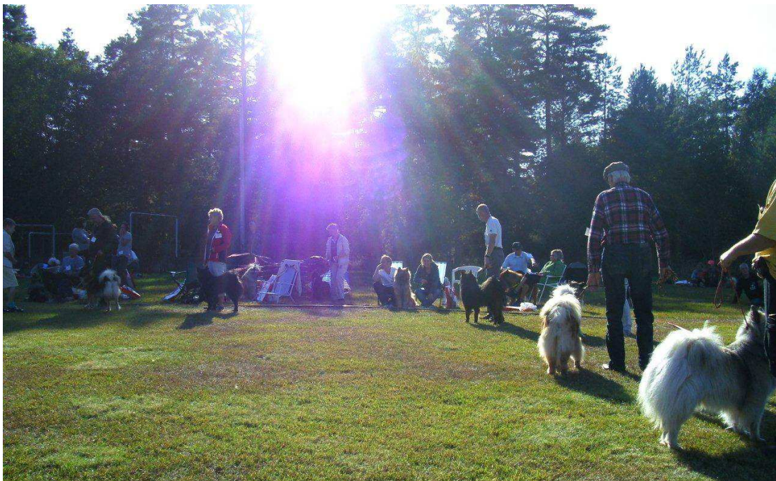
Öppenklass tikar väntar på bedömning