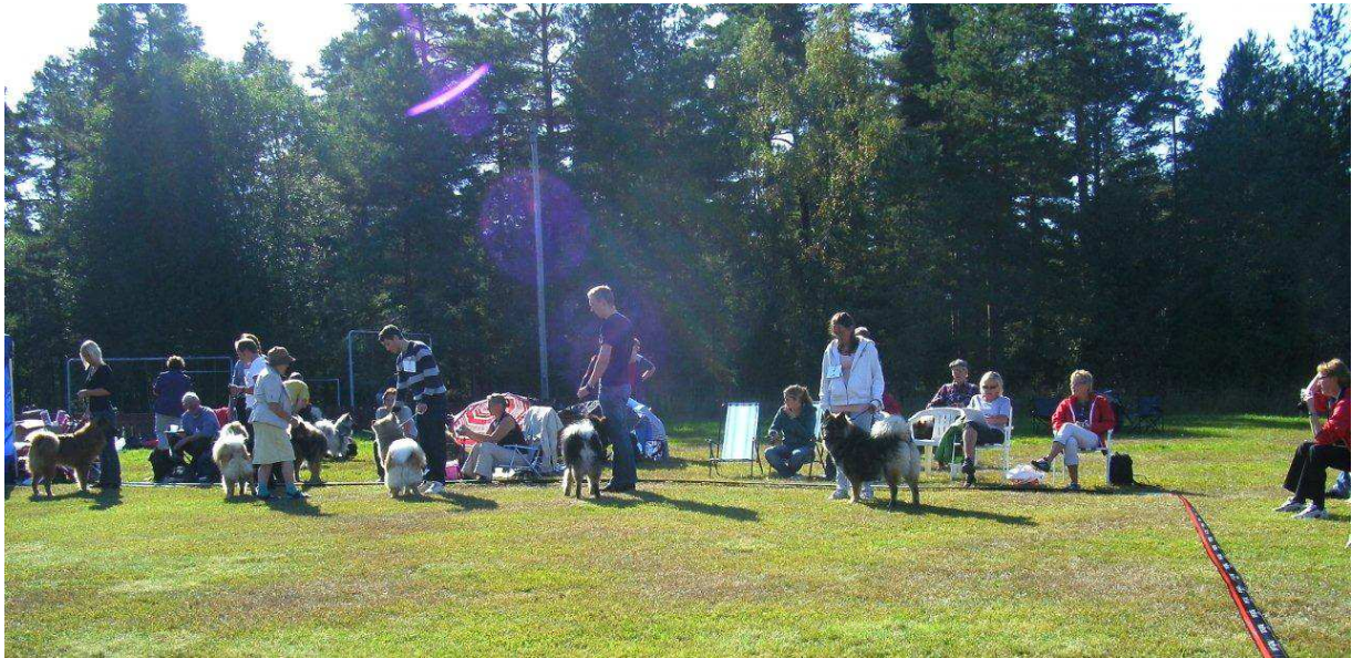
Juniorhanarna står fint