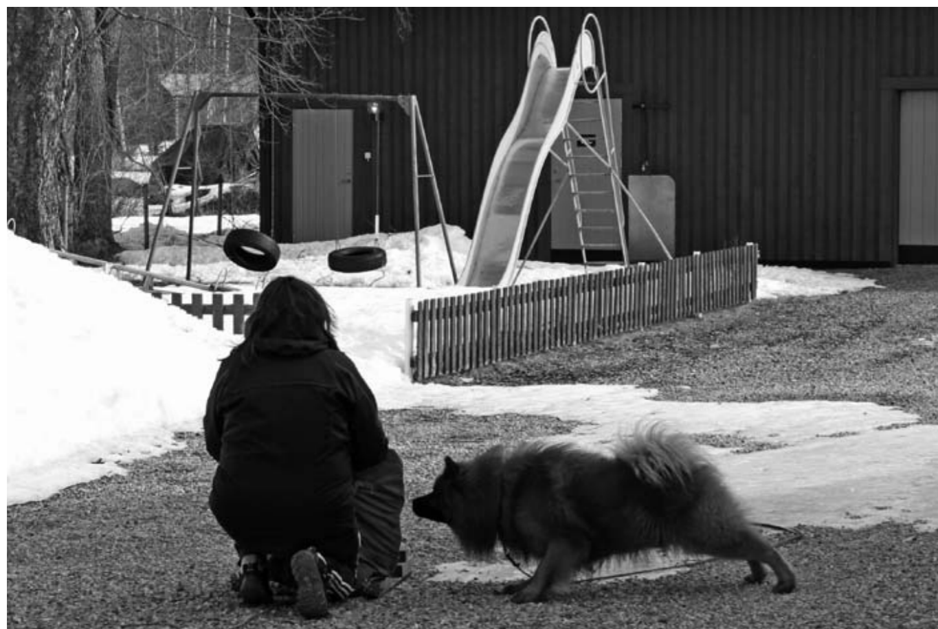
Eurasier-taxar, visst finns dom!