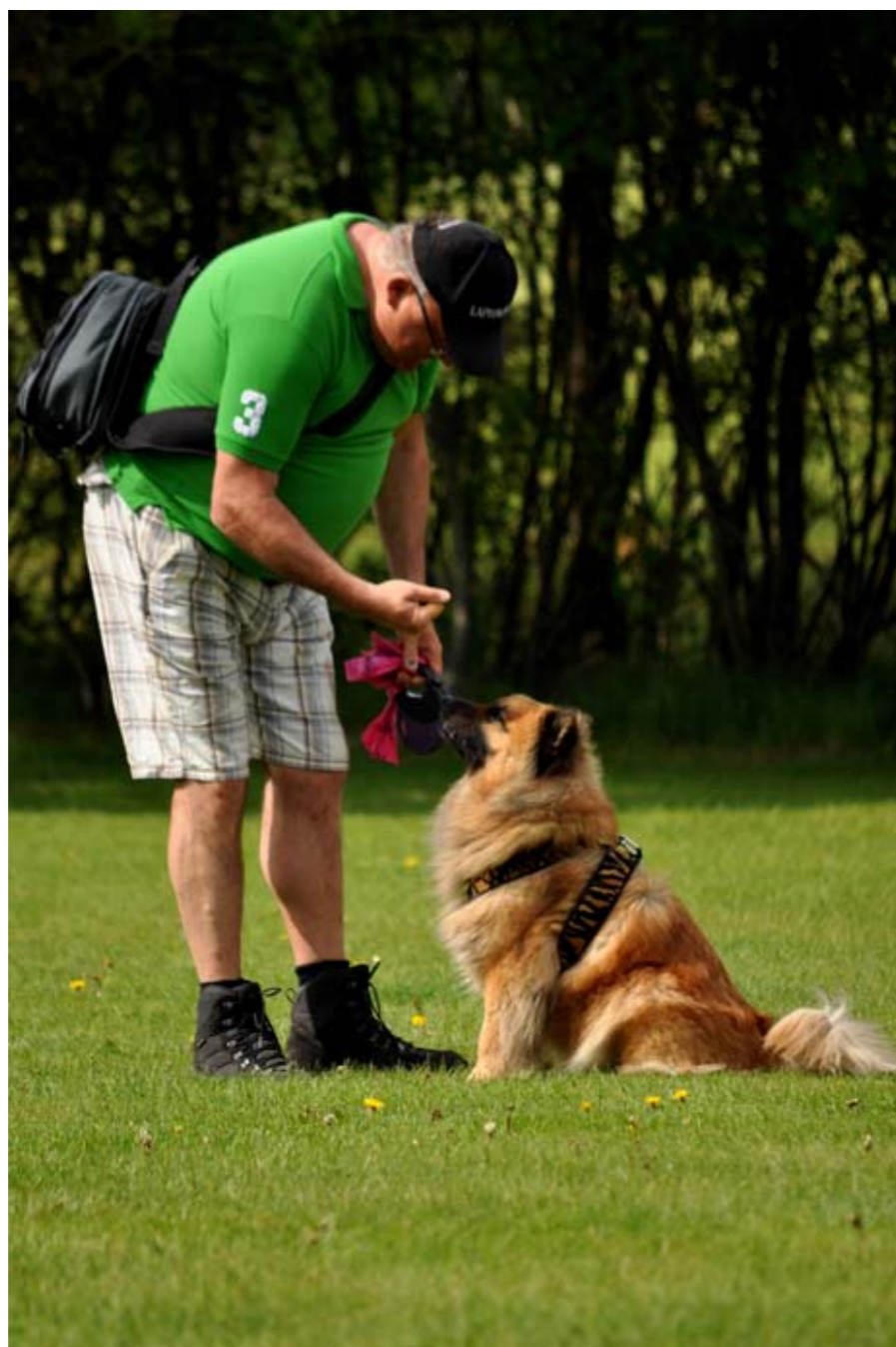
Ärling och husse diskuterar.