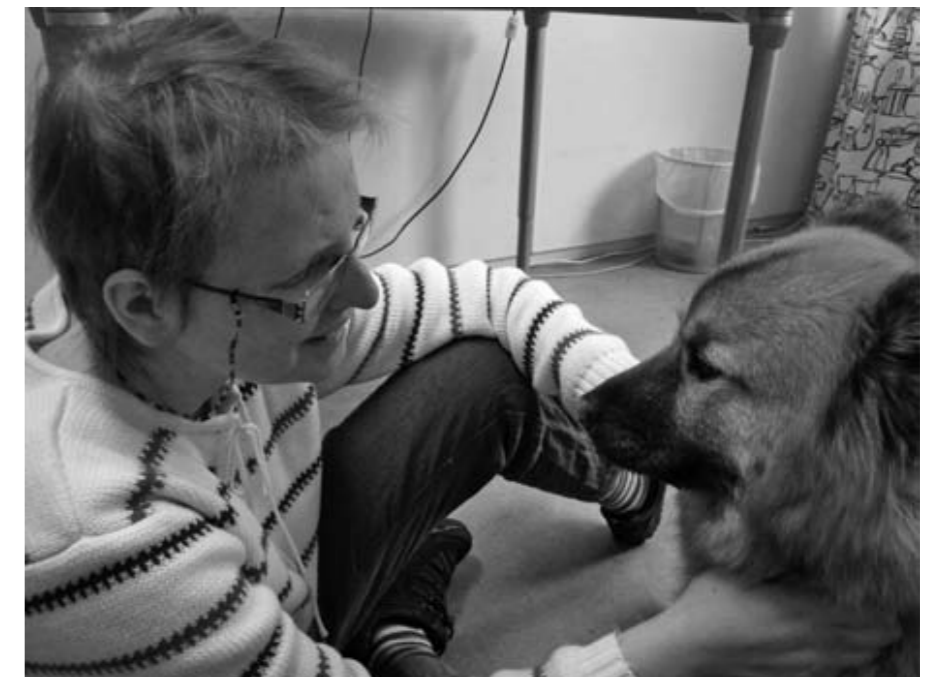
Bess tillsammans med en brukare på Resursteamet Edsbacka.