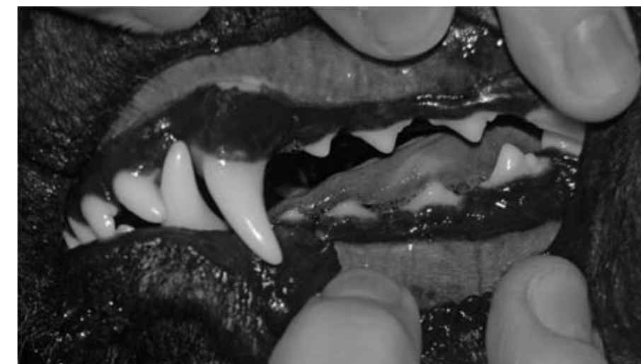
Här kan man se en eurasier med komplett tanduppsättning. På bilden ses framtänder, hörntänder, P1-P4 i övre tandraden och P1-P4 + M1 i nedre tandraden.