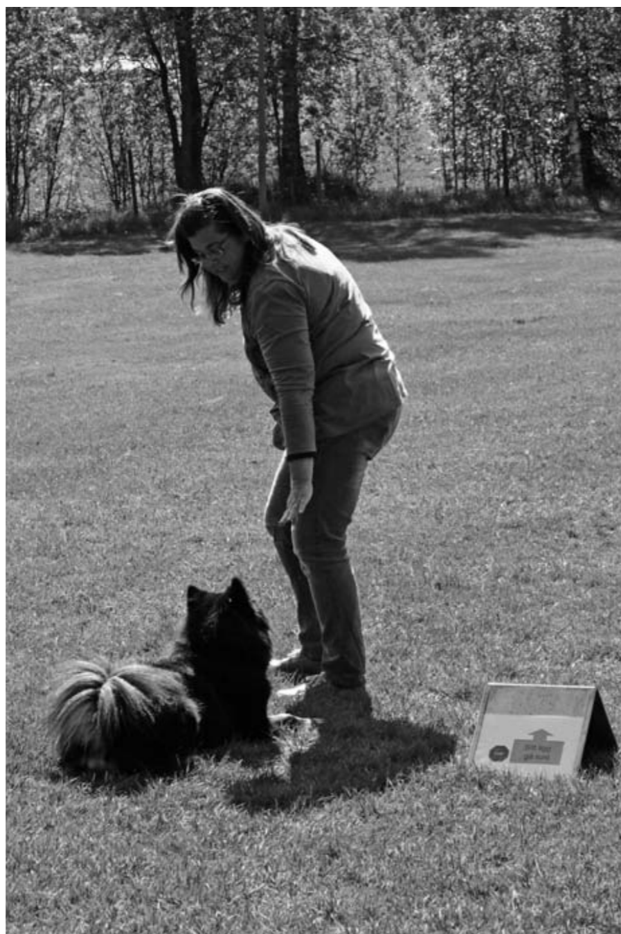
Essmanias India (Indie) ligger lydigt kvar och väntar på nästa kommando.

Tanken med rallylydnaden är inte att man ska springa en hel bana eller att det ska gå så fort som möjligt utan man ska genomföra banan i ett raskt men naturligt tempo.