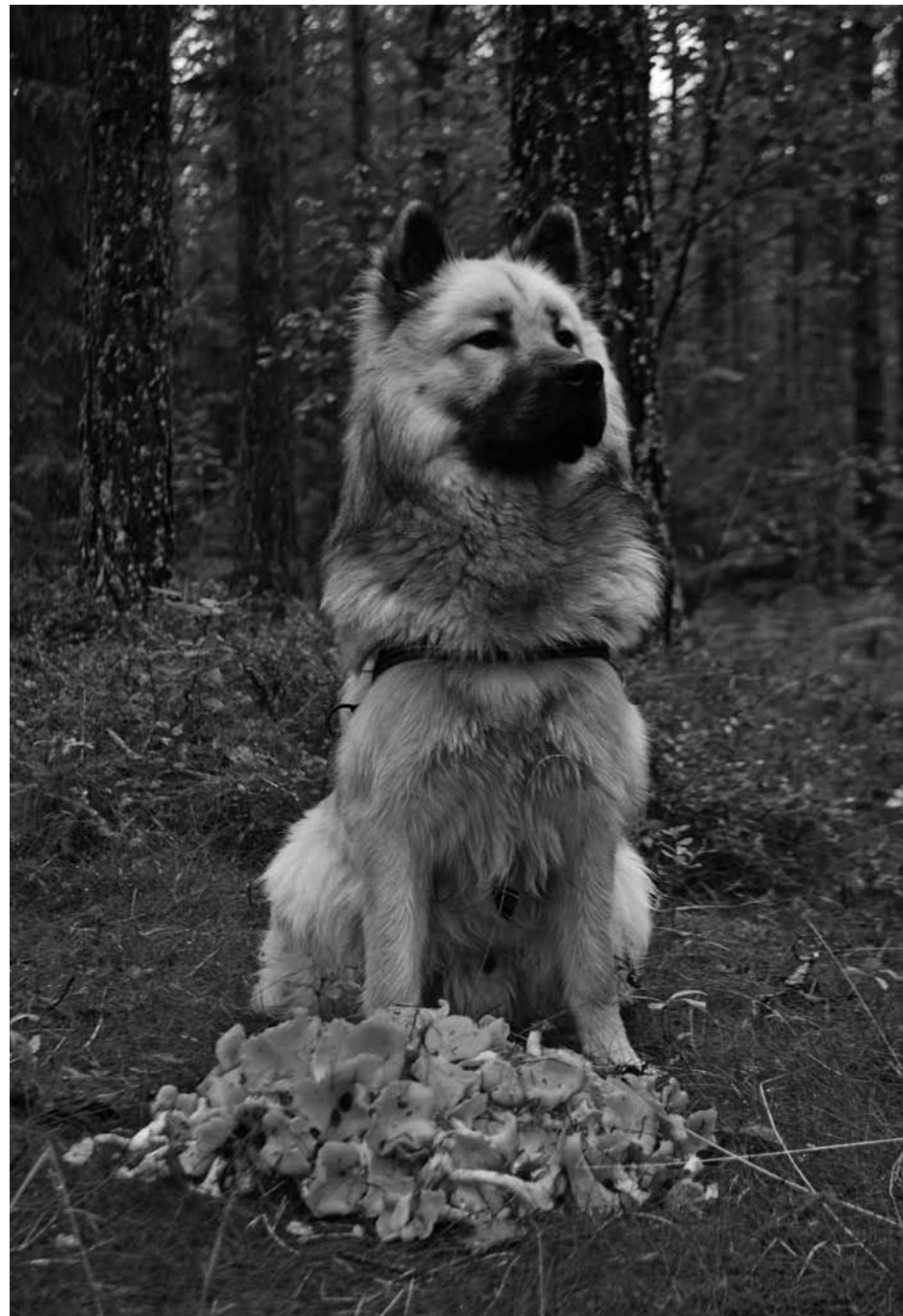
En stolt ettåring med sina allra första uppspårade kantareller.

5. In i mitten av ugnen och stek tills osten smält och fått fin färg.