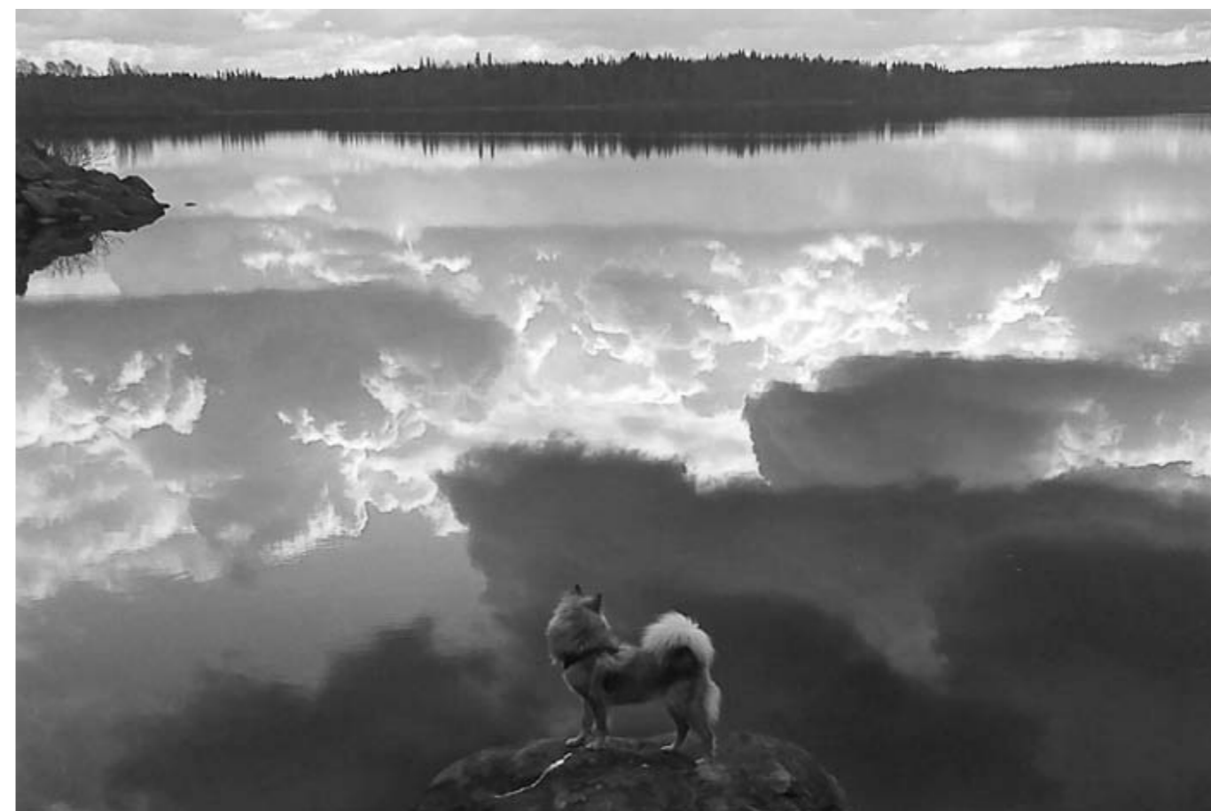
Ex Aminos Angel of sunshine.