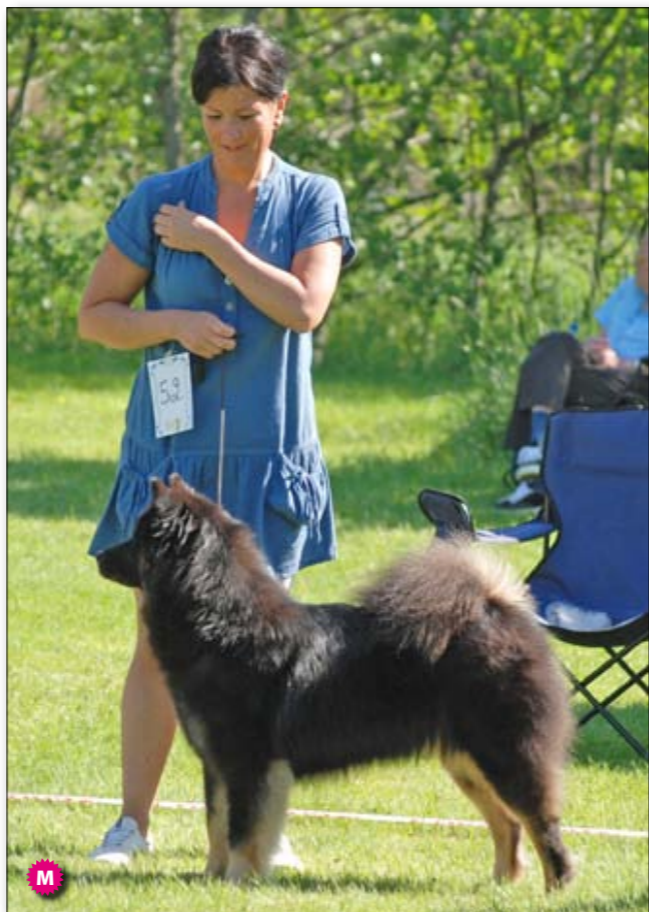
K: BIR Valp Leionspitz The one and only Takiri och BIM Bonus Pop Up's Adin