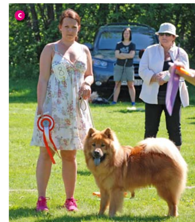
A: BIR Ludvig av Geehrbacch och BIM Essmania's Fragancia