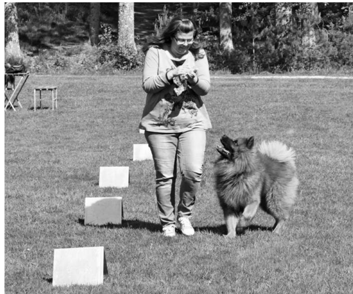
Remuz är ivrig, vad blir nästa moment tro?

Reglerna finner ni på http://sbk.nu/templates/Page.aspx?id=9084