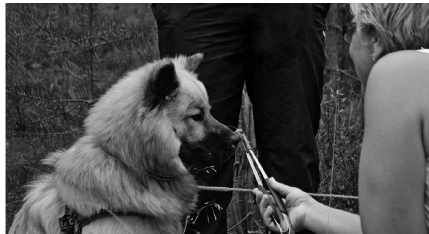
Keelo nosar på en kantarell och sittmarkerar.