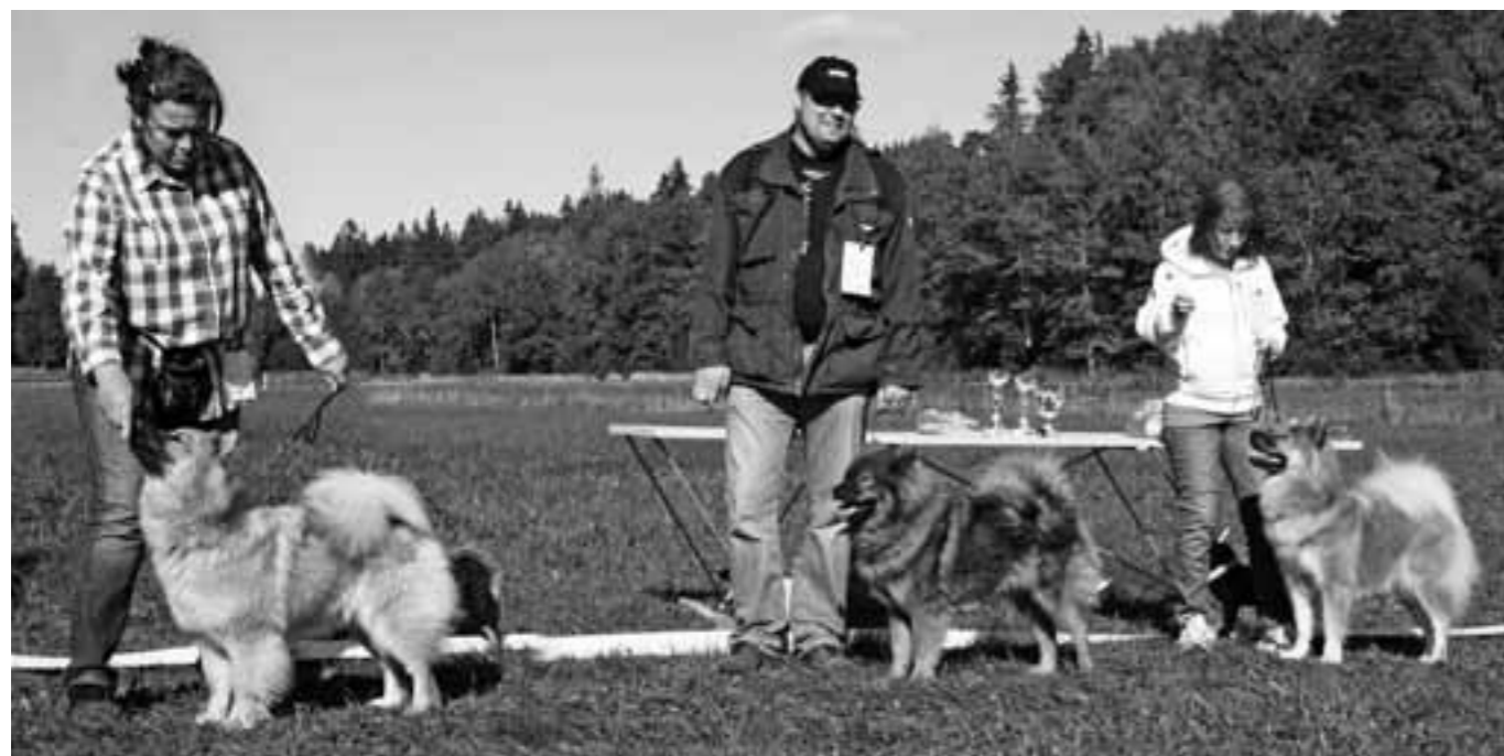
Bästa öppna tik (vänster till höger), 1:a Lejonbols Ain't she Sweet, 2:a Risan Gårdens Gurgla, 3:a Sund Stamm's Heartbreaker Harmony.

7. 14. 17. 21. 22. 25. 29. Excellent, Grupp1, HP