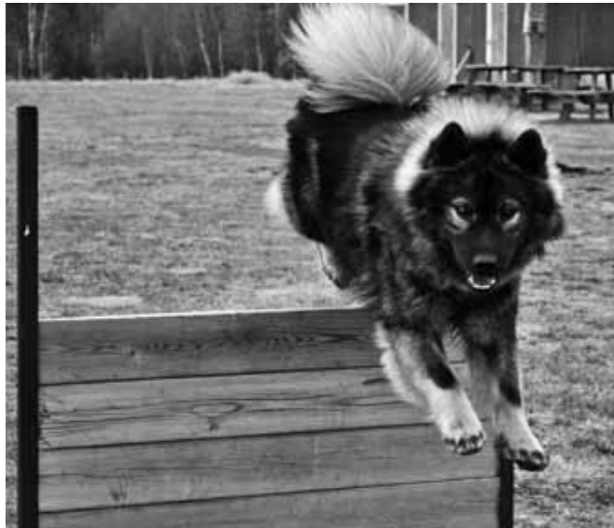
Morris flyger lekande lätt över hindret på träningsbanan.

Har tävlat och tränat förr med både schäfer och irländsk setter. Med settern kom vi så långt som till ett andra pris klass 2... sen la vi av då både jag och hund hade ledsnat helt på lydnadsträning. Det var bara resultat som räknades och man kände prestationsångest till slut. Nu är jag äldre och förhoppningsvis klokare så jag tränar korta stunder, berömmar massor och uppmuntrar min hund. Har ett helt annat "tänk" nu på hundträning och sätter inte resultat främst, vi ska ha skoj båda två annars är det helt meningslöst att hålla på. Jag tränar inte om jag inte är på humör för träning och försöker att hela tiden hålla ett lugn.