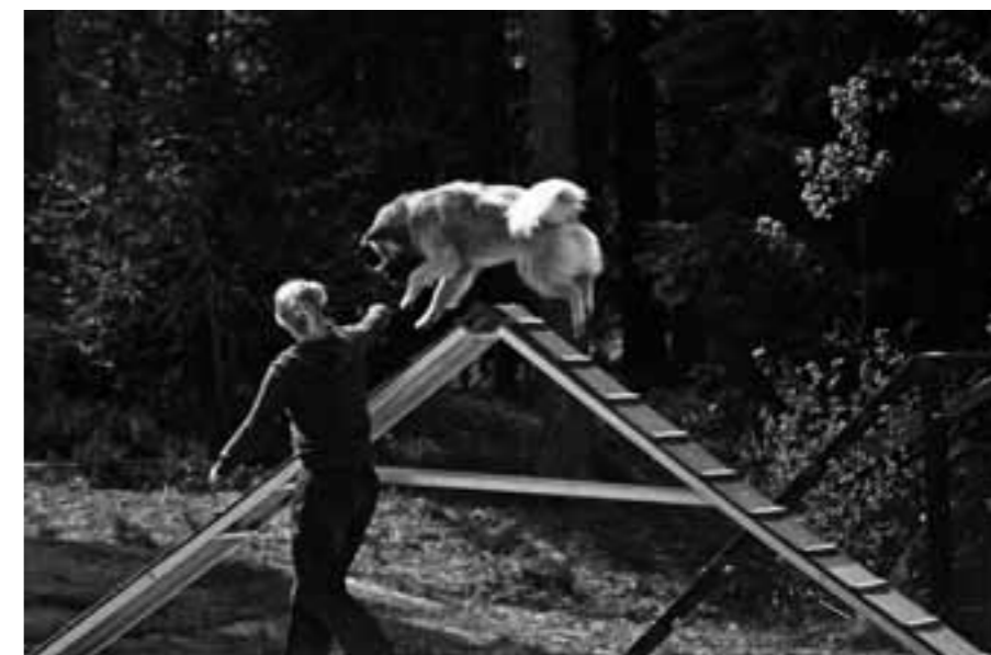
Vaddå nybörjare? Jag hoppar över toppen istället!

Söndagen blev ännu bättre än dagen innan. Alla hinder vi provat på lördagen satt nu som smort. Vi fick också prova ett nytt hinder denna dag; Gungan eller Vippen som den kallas här i Norge. Den