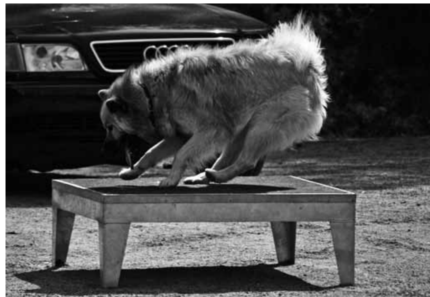
Det gäller att kunna tvärnita om man har för hög fart in mot bordet.