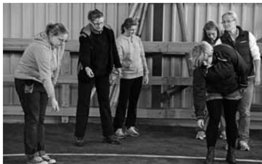
Lufthundar! Vi tränar att ställa upp hundarna med en köttbulle gömd i höger hand.

Driv är alltså viktigt. Vi fick träna att från stillastående ge ett kommande till hunden i form av några snabba klappar på hundens rumpa, och sedan SPRING! Det var inget masande runt ringen utan man skulle ränna allt vad man orkade. Hundarna tyckte förstas att det var jättekul, och det var ju meningen, att skapa lust och förväntan i utställningsringen. Då får man en hund som står stilla med en förväntan på rörelse framåt, dvs snygg hållning, uppmärksam på ägaren, pigg och alert.