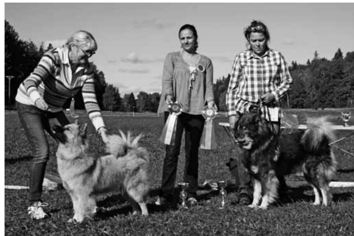
BIM Kvarnsjölidens Tilde (t.v.) och BIR Lejonbols Harry Potter (t.h.).