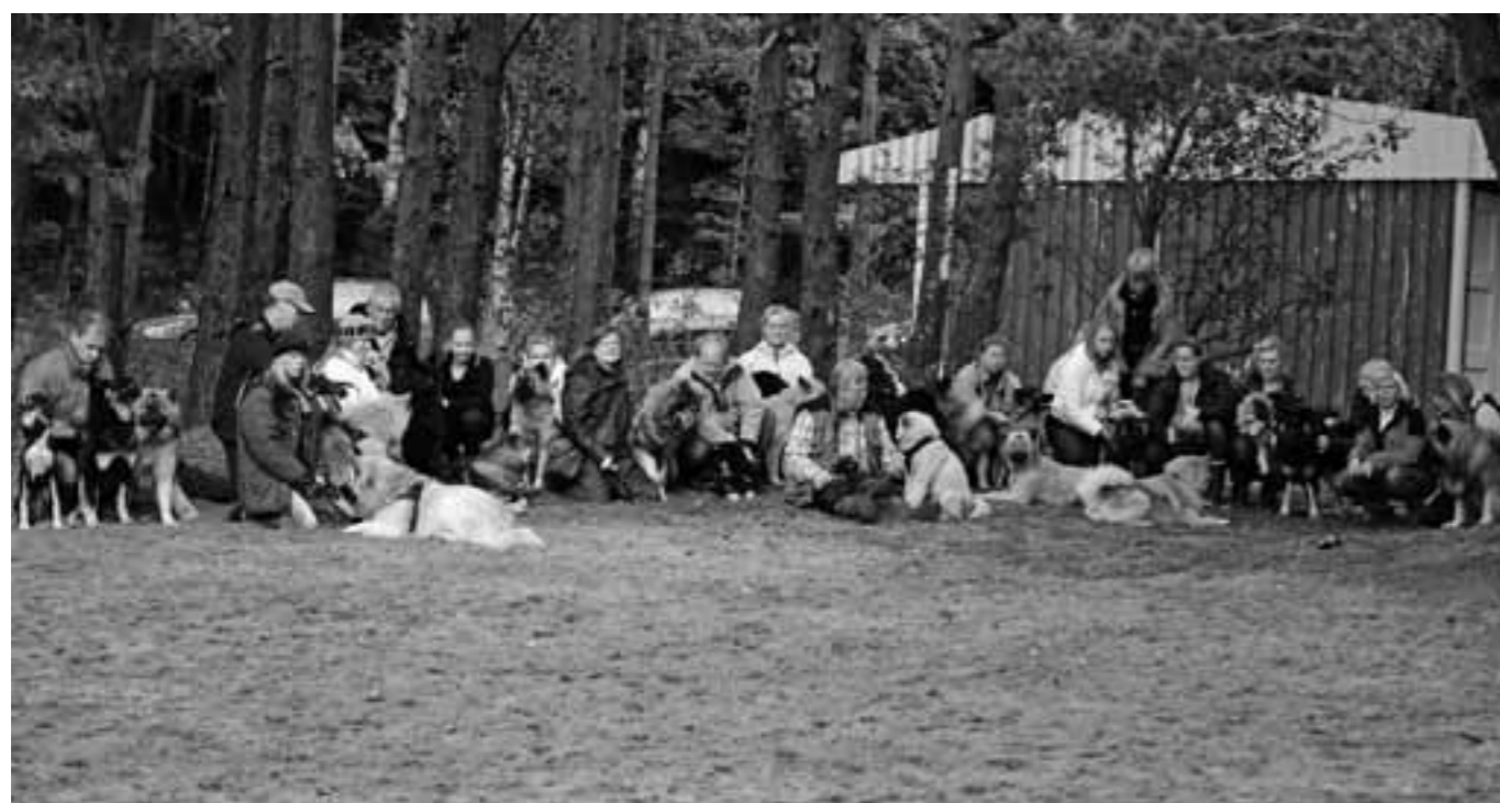
Så många var vi så att vi knappt fick plats på en gruppbild!