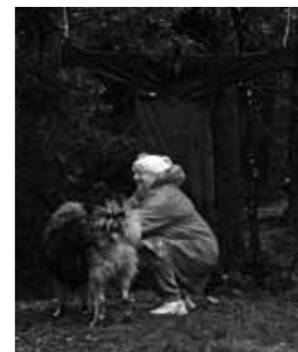
Här blir grabben (Corleone) omklappad av matte Inga-Lill efter att han skött sig fint.

framför ekipaget och hunden släpps. Hur reagerar hunden? Här ser man om hunden visar rädsla och aggression. Är hunden nyfiken och vågar gå fram till overallen? Och slutligen, visar hunden kvarstående rädsla när föraren tar hunden och promenerar förbi overallen ett par gånger. Här såg man att de flesta visade någon form av överraskning/rädsla gentemot overallen. Och konstigt vore det väl annars? Men efter ett tag så gick det bra för hundarna att gå fram till overallen och nosa, åtminstone då matte/husse följde med.