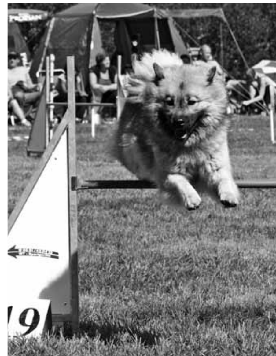
Leionspitz Nawa flyger fram på agilitybanan!

Dina fem bästa officiella resultat under året räknas (sänd bara in dem!)