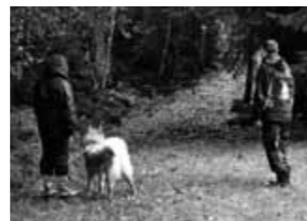
Essmanias Carnea med sin matte väntar på att momentet Förföljande skall starta.