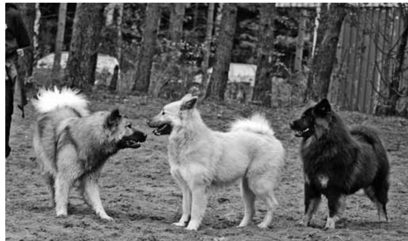
Fridlyckans Creme de Cassis (Leia), Dazzling Dainty's Bella (Ester) och Lovely Megan's Angelina Jolie (Angie).