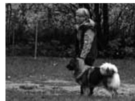
Denizli med matte Irene och kollar in den konstiga filuren som leker ensam borta på gårdet.

Denna figur börjar sedan att kasta med en grej för att få hunden intresserad och sedan gömmer den sig bakom ett skydd. Nu släpps hunden och tanken är då att denne skall springa fram till figuranten och börja leka med denne. Hunden bedöms utifrån det intresse och nyfikenhet den visar för figuren, om den visar hotbeteende och slutligen om den leker och samarbetar med personen. Här brydde sig de flesta av hundarna inte speciellt mycket om den konstiga människan på andra sidan planen, än mindre ville de springa fram och leka. Däremot då matte/husse följde med så gick det bättre. Anledningen till att jag tyckte att just detta moment var så konstigt är för att det enligt min uppfattning är ganska bra med en hund som inte visar särskilt mycket intresse för främmande människor som rör sig långt borta, och att de då också skall springa fram och eventuellt börja leka med denna okända människa, ja det känns inte som en positiv egenskap i min värld.