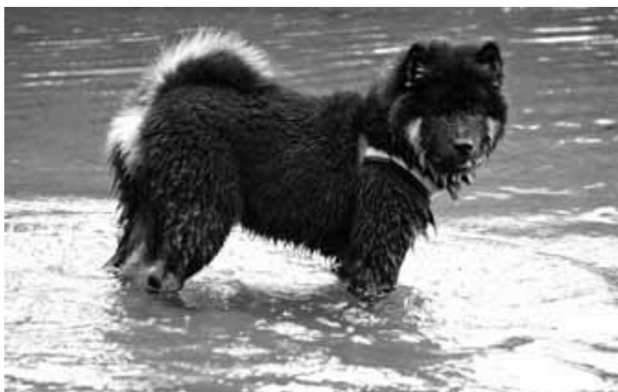
Essmania's Gandia har tagit sig ett rejält dopp!

Efter en kort promenad så att hundarna skulle lära känna varandra lite så stannade vi vid den stora badplatsen, där de som kunde ha sina hundar lösa fick släppa dem och de fick leka med varandra, några passade också på att bada (och rulla sig och gnugga in sanden ordentligt!). Vi satte fart på en brasa och en del grillade korv medan andra stoppade i sig mackor, kakor