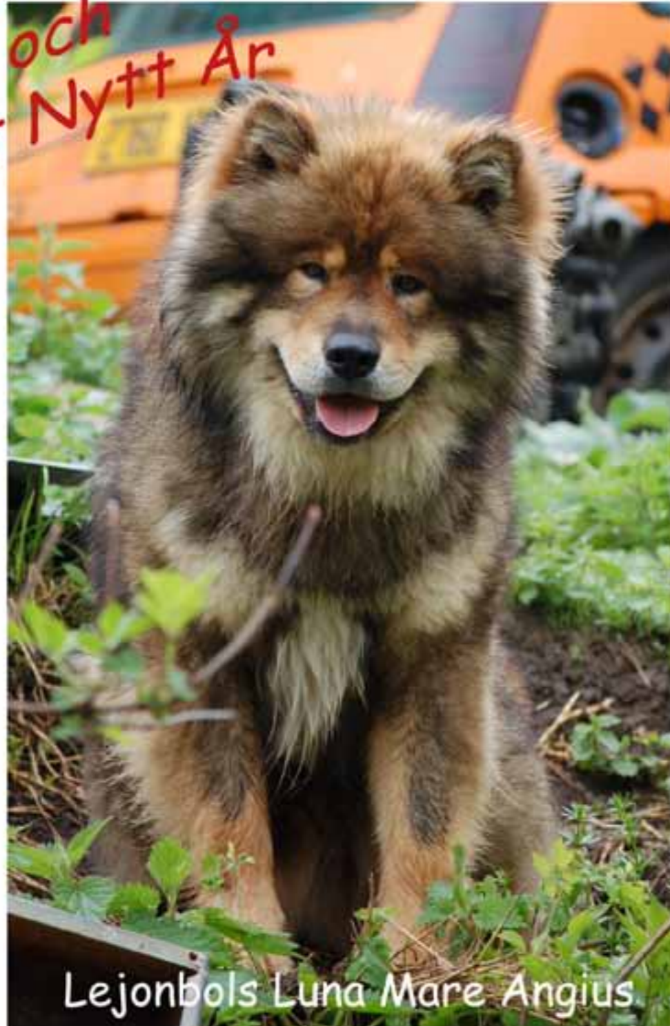
Lejonbols Luna Mare Angius