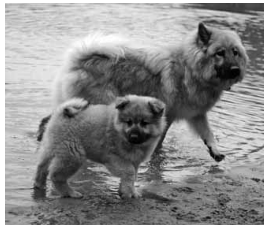
Essmania's Allie med en av sina valpar.