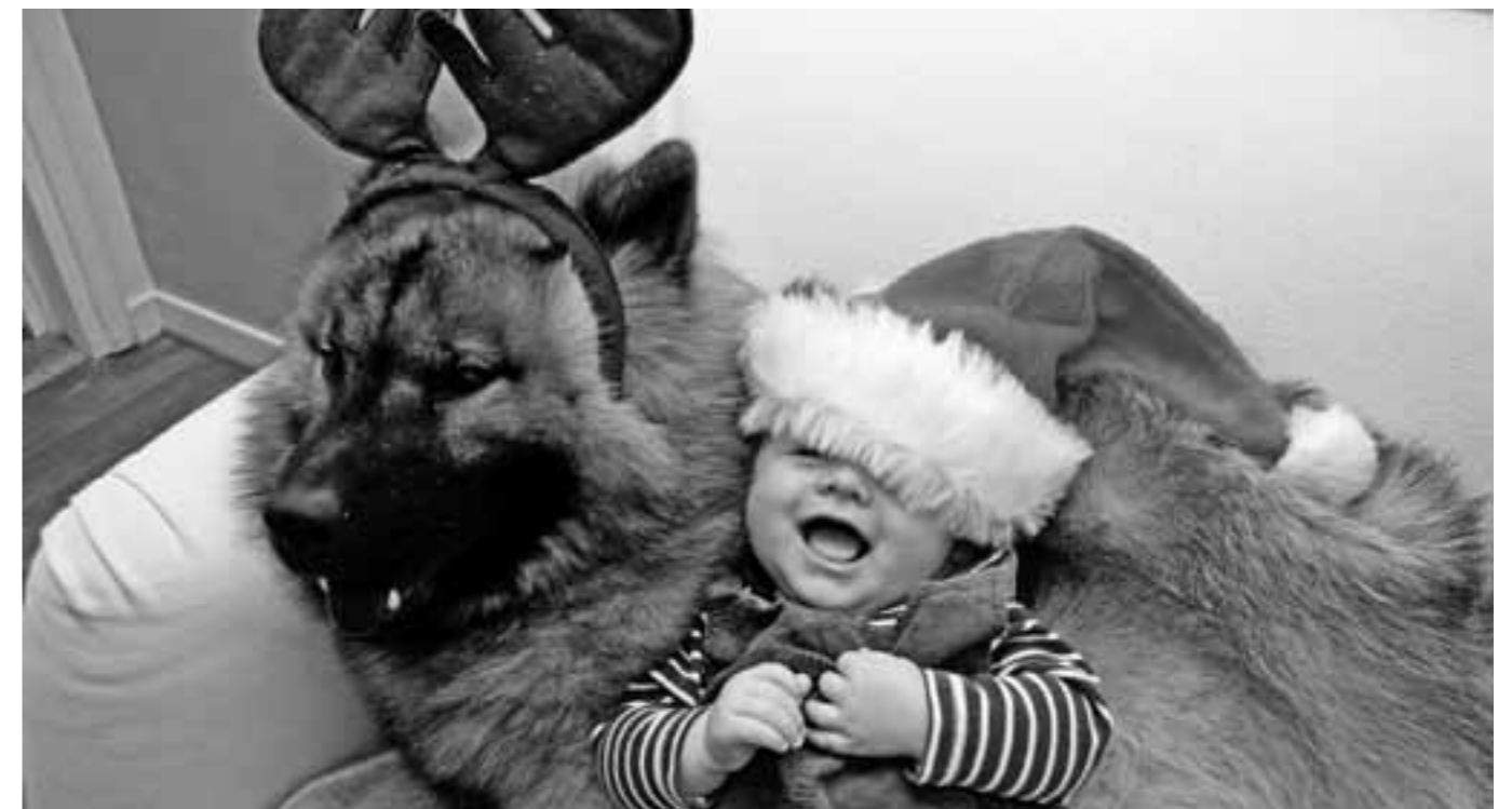
Julen för med sig värre faror än att bli utsedd till modell för årets julkort, som Morris (Leionspitz Uno) blev 2008.

Källor: Veterinärspalten av vet. Elsie Lindstedt och/eller Olle Görman. www.glanna.se