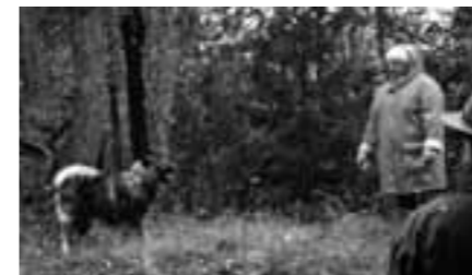
Essmanias Corleone (Rocky) utövar momentet Aktivitet, med matte Inga-Lill.

ganska lugnt. Var väl en och annan som tyckte att det blev lite långgrandigt efter en stund men de flesta var ganska coola.