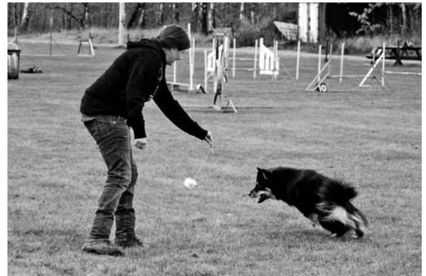
Lek som belöning.