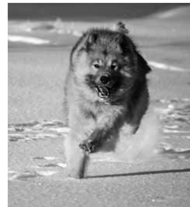
Hunden på bilden har inget med artikeln att göra.

källa: Hälge, Bättre hornlös än rådlös, av Lars Mortimer.