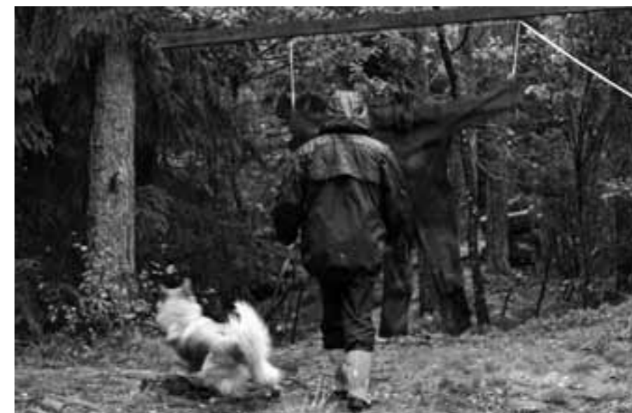
Carnea tyckte inte att overallen var så rolig. Äcklig sak som flyger upp framför en mitt i skogen.

Åter till momenten, nu följer: Överraskning. Föraren och hunden promenerar i skogen. Helt plötsligt dras en overall upp