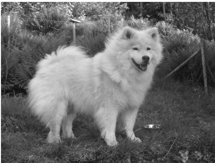
En pigg och glad Laika i juni 2010, fortfarande tjock päls men under 24 kilo.

Läs mer om sköldkörtelrubbning hos hund i den bra beskrivning som finns av veterinär Leif Hokfors i Eurasierbladet nr 4/2009. Numret finns som pdf på klubbens hemsida under Eurasierbladet/Tidningen.