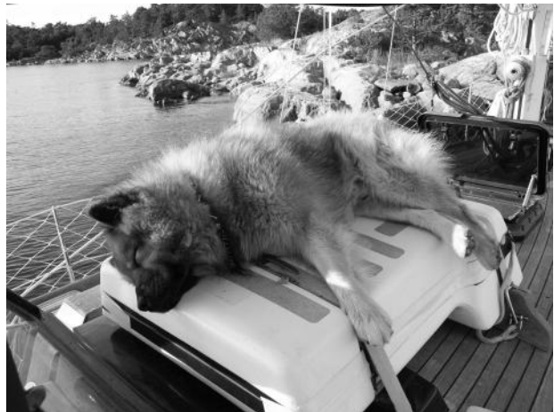
Hannibal på flotten

På denna sidan östersjön är vattnet betydligt sämre än hemma. Enorma ärtsoppelika algbälten och mycket dåligt siktdjup. Vi får ständigt ha med oss vatten till Hannibal och passa honom så han inte går och dricker ur sjön. En algsup och hunden kan vara död inom en halvtimme har vi hört. Tur att eurasiern inte är lika badglad som den goldenhanne jag hade som barn.