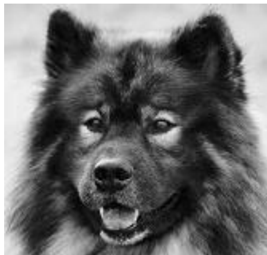
Från eran Sund Stams Pom-Poms Pigalle Alias Nalle

Tass,kram och allt det där till er alla ute i landet och i våra grannländer.