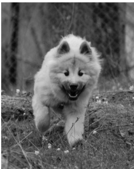
Essente Ofedor Ostar "Rambo"