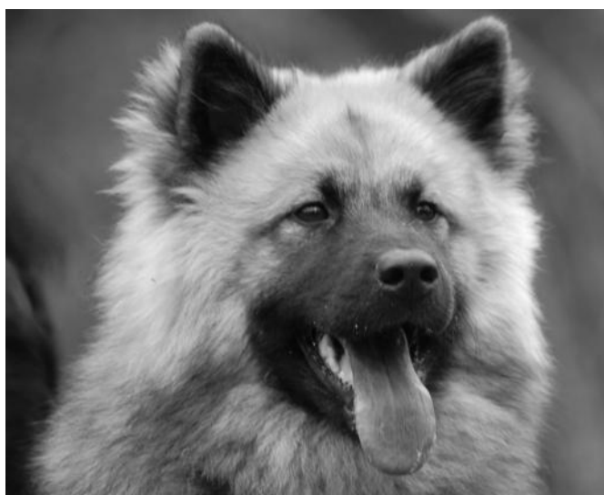
Foxfire Attractive Afrodite "Tequila"