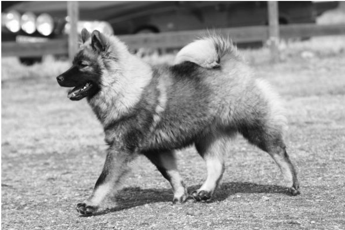
Risan Gårdens Hulken "Morris"