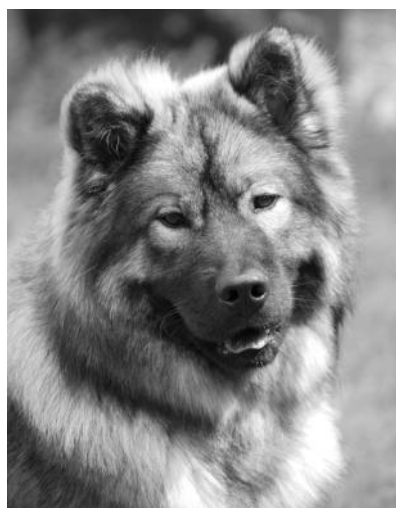
Leionspitz Lovely Lyvan