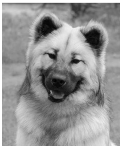
Leionspitz Lovely Lupus