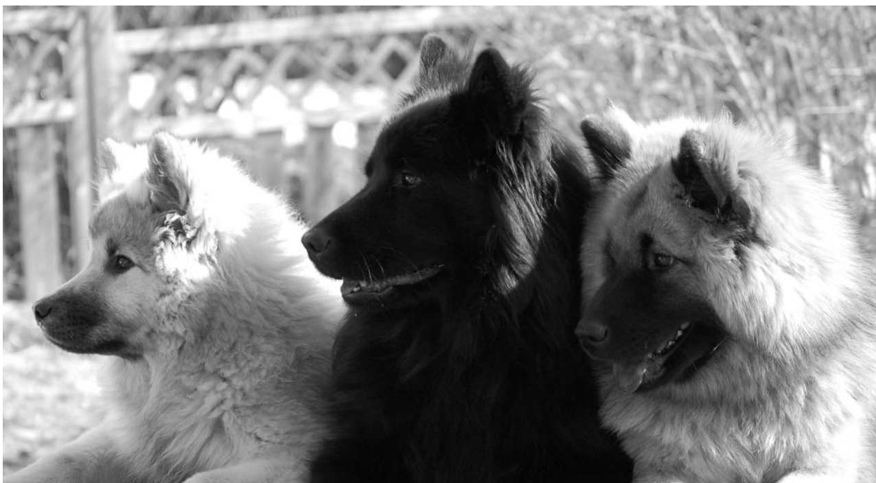
Essente Ofedor Ostar "Rambo" - Foxfire Queen of Black Gold "Molly" - Foxfire Attractive Afrodite "Tequila"