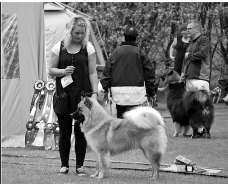
Lovely Megan's Danny Dayton