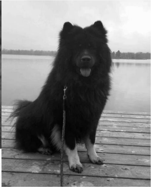
Lovely Megan's Ben Stiller "Laban"