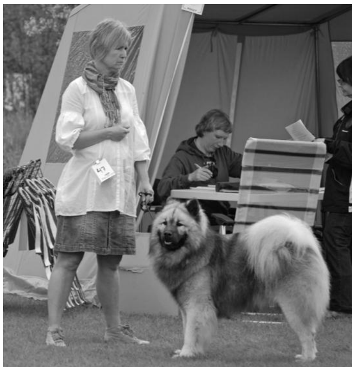
DaQela's Piri Piri