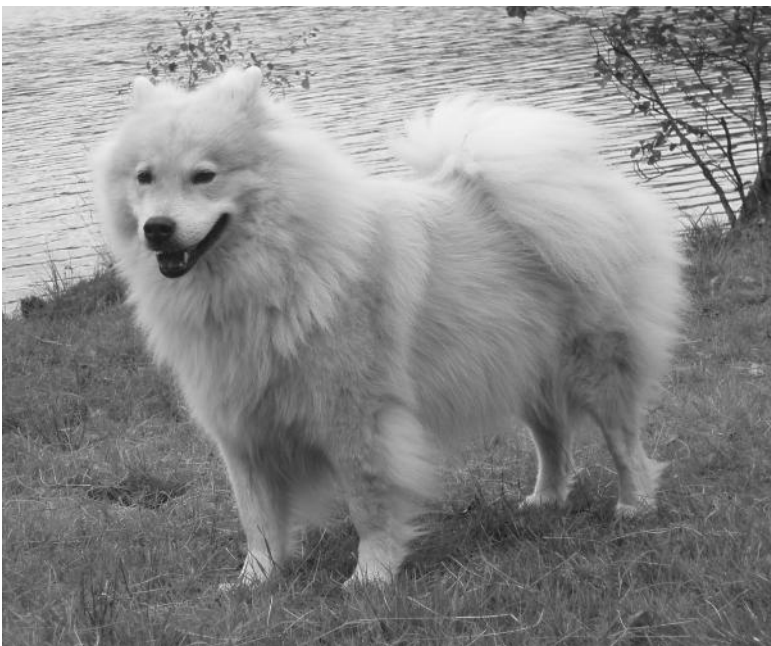
En trött och ibland grinig Laika sommaren 2008 med tjock päls och kropp, nästan 30 kilo.

Uppvärmningen var viktig, och jag fortsatte med massagen för stelheten syntes då och då, speciellt när hon hade legat stilla länge. Vi satte henne även på en Omega-3-rik lågenergikost bestående av strömming, korngryn, vitkål, vitaminpulver och solrosolja kompletterad med grovrivna morötter som utfyllnad och för att magen skulle fungera bra. Godsakerna bestod av max 50 gram äkta vara, dvs kött eller kyckling, inga färdiga hundmatskolor. Kombinationen av Levaxin och den specialkosten gav väldigt bra resultat. Receptet på maten fick jag av en utbildad dietist, och Laika äter fortfarande samma mat, men nu kan vi ibland göra uppehåll och hon äter då färdiga kulor baserade på lax.