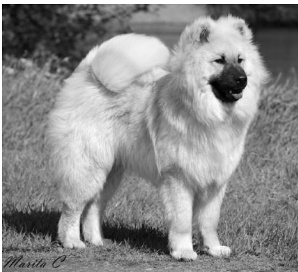
Foxfire Brilliant Benji

Jag kammar igenom pälsen en gång i veckan. Och när de fäller blir det varje dag.