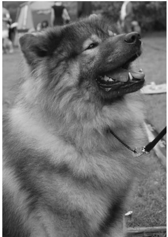
Ronevikens Ambers Flinta "flinta"