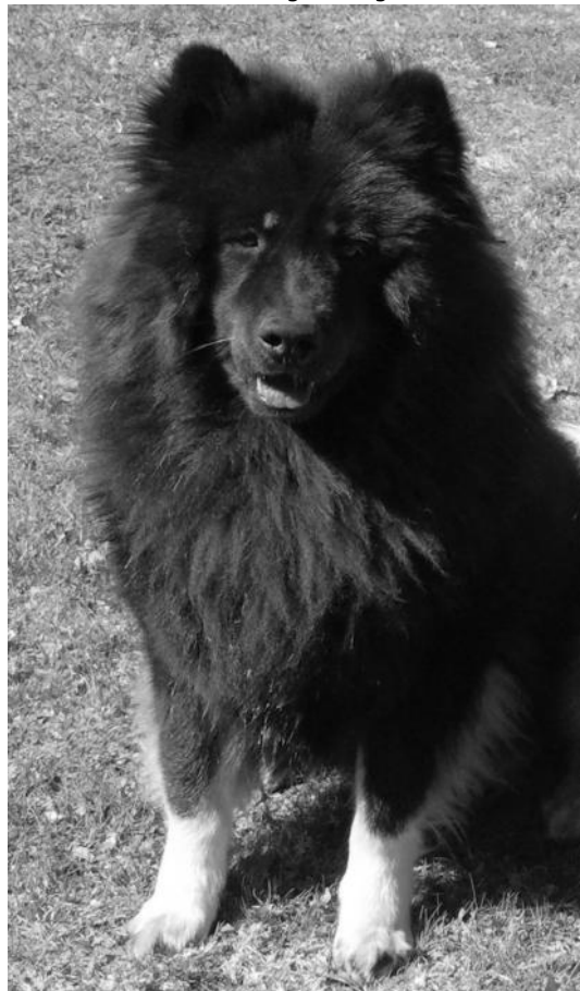
Lovely Megan's Ben Stiller "Laban"

Det är enormt svårt att få in honom, han ligger på den stora stenen och ser sig omkring flera timmar i sträck. Ju mer snö desto bättre. Regnrusk går också bra.