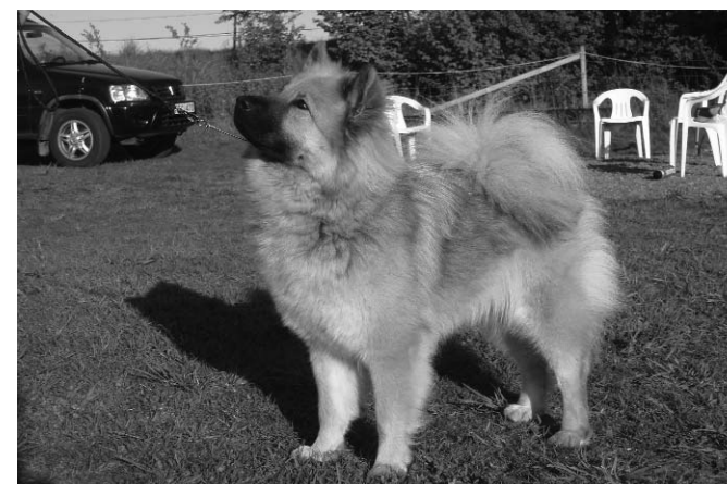
Vad det så här snyggt du ville att jag skulle stå, matte?