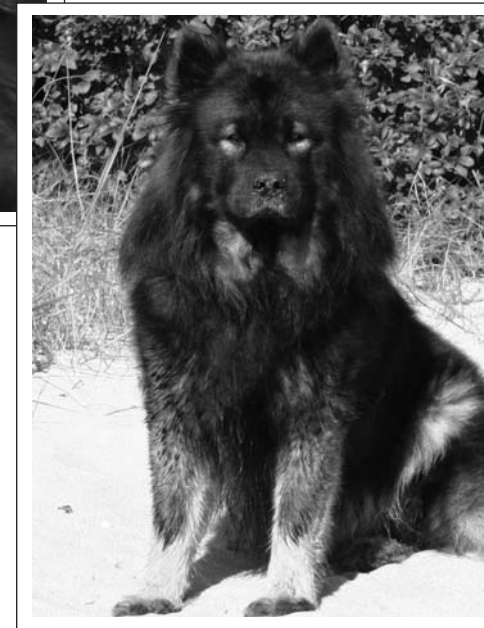
Sund Stamm´s Marques Monte Simon