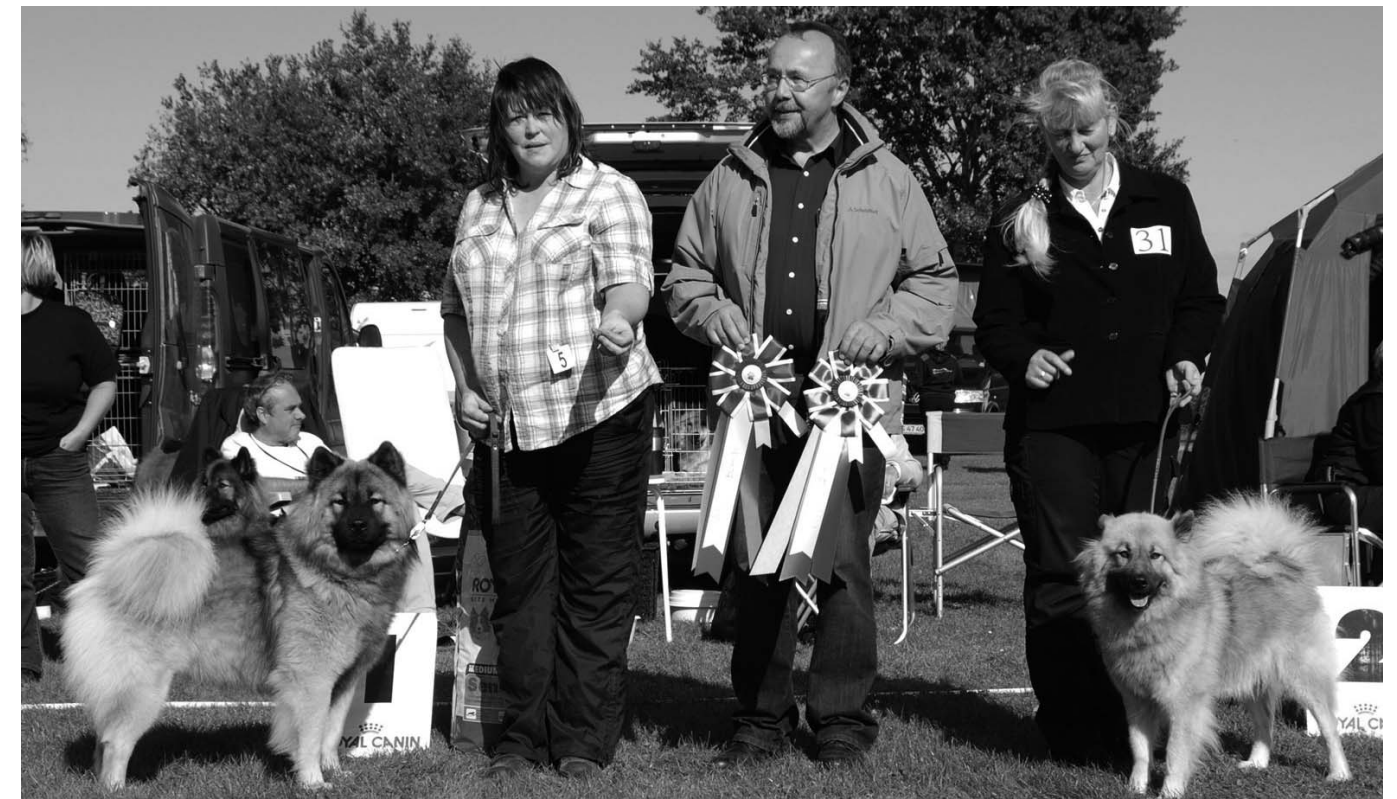
SUCH DKUCH Leionspitz Unic blev BIR/BIS, BIM gick till en dansk tik vid namn DKUCH Ackaciebakken Blue Lagitha.

Utställningen hölls på Fyn, den "lilla" ön mellan de två andra, längst upp i den norra delen som även kallas Fyns huvud.