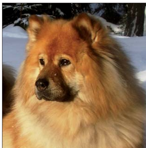
NOISETTE DE CHOW`S DE MONG HA