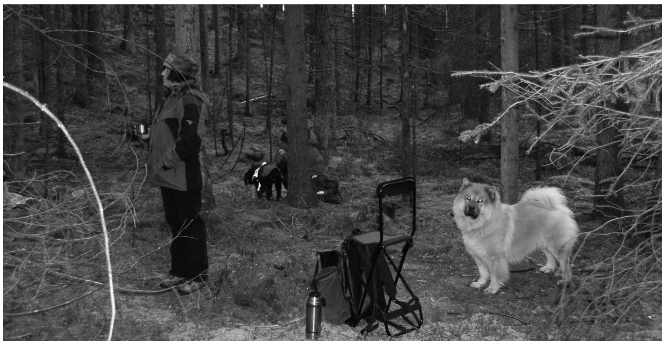
Medan spåreren kallnar fikar vi. Total skogsupplevelse med andra ord.

Det är verkligen roligt med viltspår, både för hund och förare, och det passar vår ras bra. En del vill inte börja med viltspår för de tror att hunden börjar jaga på egen hand, men om man tränar viltspår på rätt sätt så behöver det inte innebära att jaktlusten ökar. Tvärtom, hunden får utlopp för sin lust att spåra, men på ett kontrollerat sätt. Den lär sig att det är bara när man tar på spårsele och lina som det gäller, inte annars. Det är också bra att alltid träna med blod, för då riskerar man inte att hunden drar iväg själv i skogen när den träffar på ett "riktigt" spår.