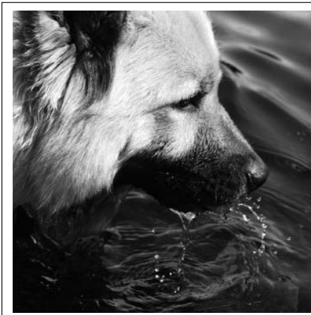
Leionspitz Chanel Fotograf Lotta Ahlvin