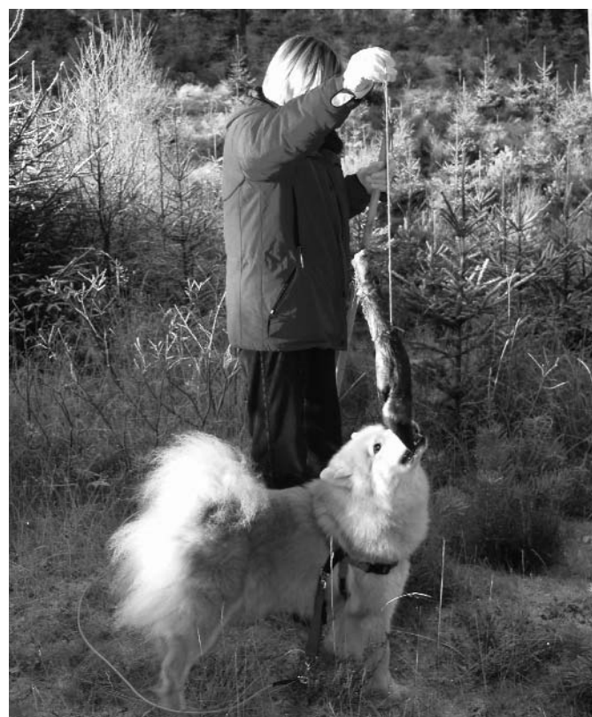
Släpp ner benet matte! Laika med sitt goda byte.

Text: Yvonne Benzian & Anna Frisk