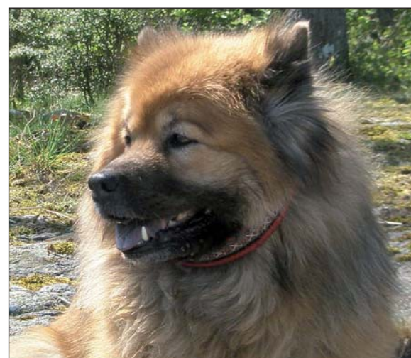
SUND STAMM`S POM-POM`S PASTELLE