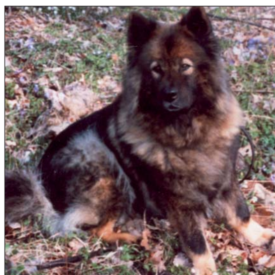
SUND STAMM`S POM-POM`S PAULETTE