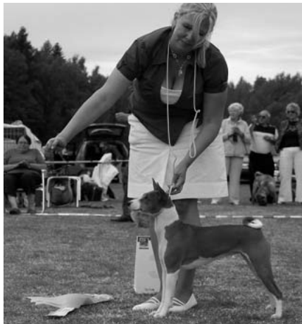
BIS-3 BASENJI – NORDJV 07 NORDV 07 ENIGMA TOUCH OF MAGIC ÄG. CARINA MORÉN, UPPLANDS VÄSBY