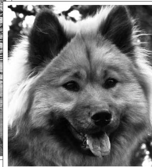
Leionspitz Beautiful Basima