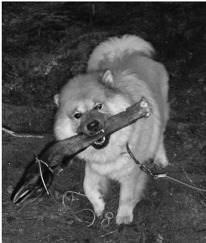
Man kan bli galen för mindre! Atlas med sitt "byte" efter en lyckas spårning.

mar innan hunden börjar spåra. I Öppen klass har man skottprov, dvs när man är ca 50-100 meter ifrån spårslutet får man stanna med hunden. Domaren går ca tio meter från hunden och avlossar ett skott. Sedan får hunden fortsätta i spåret. Att man skjuter beror på att man vill skapa en så verklig situation som möjligt. I den öppna klassen tilldelas hunden första, andra, tredje eller inget pris. Man får en kopia på protokollet med sig hem.