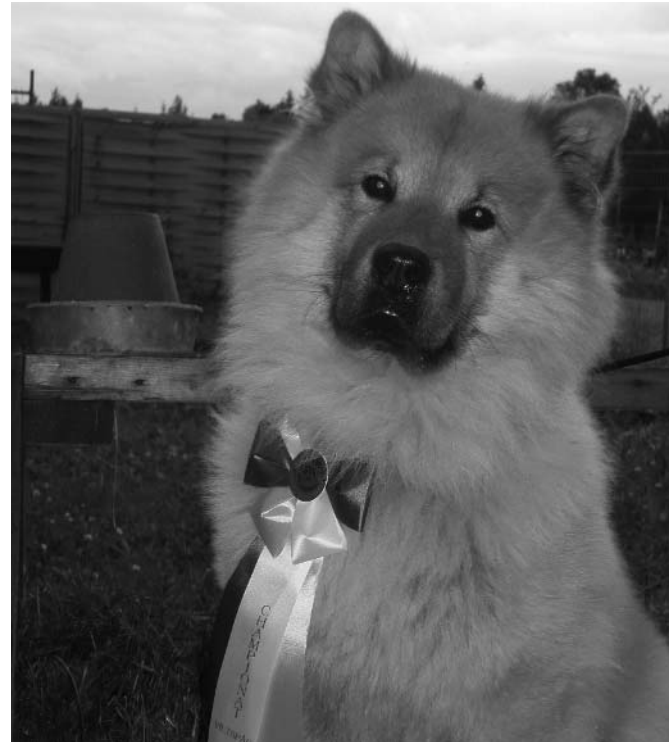
Numera är Atlas stolt Viltspårchampion

På viltspårprov får alla hundar över 9 månader delta, även blandraser och oregistrerade hundar. I övrigt följer man tävlingsbestämmelser