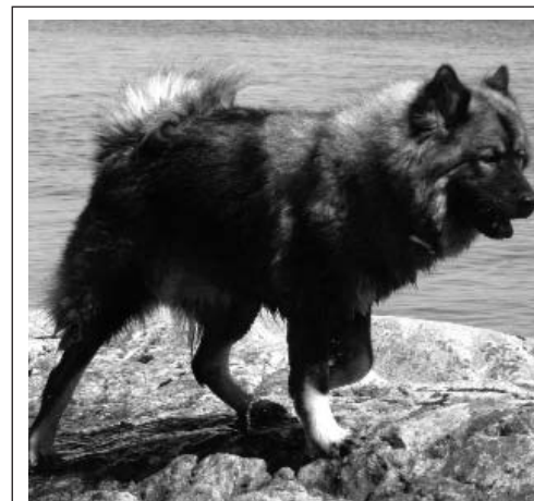
Balder- Balder Ystra Vidfamne