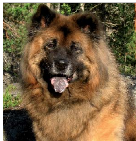
SUND STAMM`S LORD LANSON