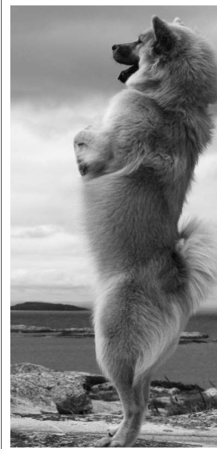
Albionspitz Else